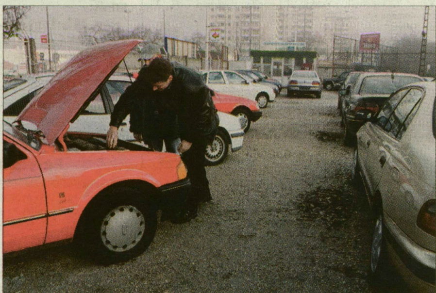
Használtautó-piac: pangás után lesz-e élénkülés idehaza?

Lassan két hónapja, hogy eltörölték a külföldről behozott új és használt autók után a vámot. Pontosabban, az Európai Unió tagországaiból származó négykerekeket után kell ezután kevesebbet fizetnie annak, aki begurul vele az országba. Mindez csak első hallásra tűnik nagy megtakarításnak, ám tavaly már a 2 százalékos sem érte el a behozott gépjárművek után fizetendő vám. Jelentős ár-csökkenésre így nem kell számítani. Sokan a külföldi számlákkal igyekeznek ügyeskedni, s így megtakarítani három-négyezer forintot.