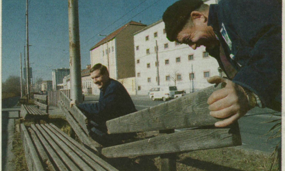
Padot gyógyítanak a munkások.

Munkatársunktól A szegedi vandálok selejtező nélkül részt vehetnének a pusztítási világbajnokságon. A számok azt mutatják, túlzásról szó sincs. Ugyanis miközben egyik csoportjuk 1,2 millió értékű fát tört derékba tavaly, a másik vandálrészleg 725 ezer forintos kárt gyártott virágtaposás közben, a játszótérek hintáival harcolok után pedig 6,2 milliót kellett a játékszerek kijavítására költeni. De milliókban méri a kárt a buszokat üzemeltető Tisza Volán, valamint a villamosok és trolik gazdája, a Szegedi Közlekedési Társaság is. (Írásunk a 7. oldalon.)