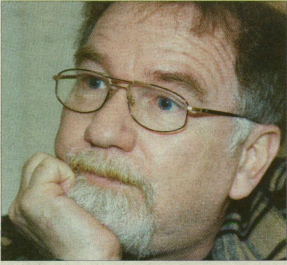
Vágó István: „A vetélkedőműsor-vezetés bizonyos értelemben skatulya.”

Munkatársunktól Ebben a játékban a műsorvezetőt csak gyűlölni lehet, szeretni nem – mondja Vágó István a Legyen ön is milliomos!-ról. A vegyész-mérnök lett televíziós szerint a vetélkedő olyan, mint egy szappanopera, melyben – maga is elindulna. 25 éves pályafutása alatt ugyanis olyan tudásra tett szert, hogy a kérdé-