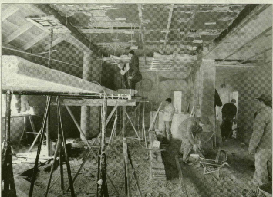
Így lesz ez majd szép! Almennyezet, új burkolat, tágasabb tér. Formálják a balástyai házasságkötő termet.

Ezek a polgármesteri hivatalok, templomok. Olyan ünnepi helyek, amelyekre illik odafigyelnie nemcsak a házasulandóknak, a megházasodóknak, hanem főntartó gazdáknak, a falunak, városnak. Balástyán áldoztak a házasságkötő terem széppé formálására. Tulajdonképp a polgármesteri hivatal átalakításához is emitt kezdtek. A Területfejlesztési Tanácshoz adtak be rá pályázatot. Mivel volt spórolt pénzük a falukasszában, csaknem másfél millió forint, a kívánt munkálatokra kaptak még 3 millió hat-százezer forintot, így majdnem a duplájára növelhették a házasságkötő terem alap-