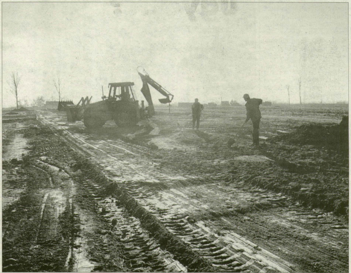
A makói ipari park is megérezhetheti, ha a döntések „elmennek” a kistérségből.

Tény, hogy a szocialista kormányzati ciklusban elfogadott területfejlesztési törvénynek szinte csak egyetlen erőnyom volt: az, hogy megszületett, és arra készítette a magyar önkormányzatokat, hogy egyre többet pályázzanak; hogy elkezdjék tanulni az euróbuokrácia működését. Az uniós példa alapján nyil-