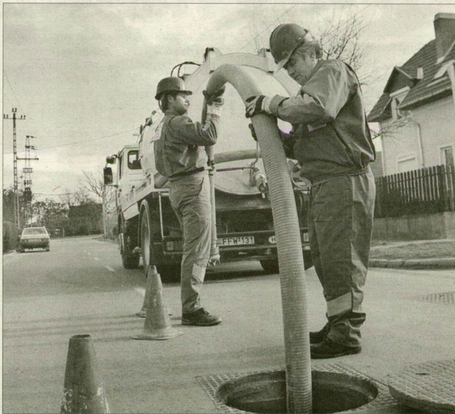
A Végvári utca két „csatornázott” ingatlanjának szennyvizét hetente kétszer kell elszállítani.

Három esztendővel a csövek lefektetése után az egyik