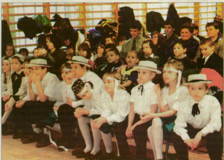
Színpadi fellépés előtt a csengelei ifik táncos csapata.