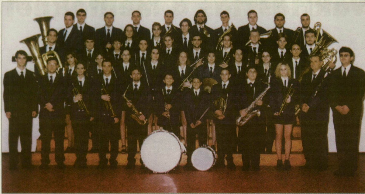
Együtt a világtörő nagy csapat. Ünneplőben a kisteleki zenekar.