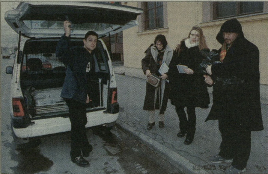
A forgatócsoport. Pénz már öt hónapja nem érkezett a számlájukra.