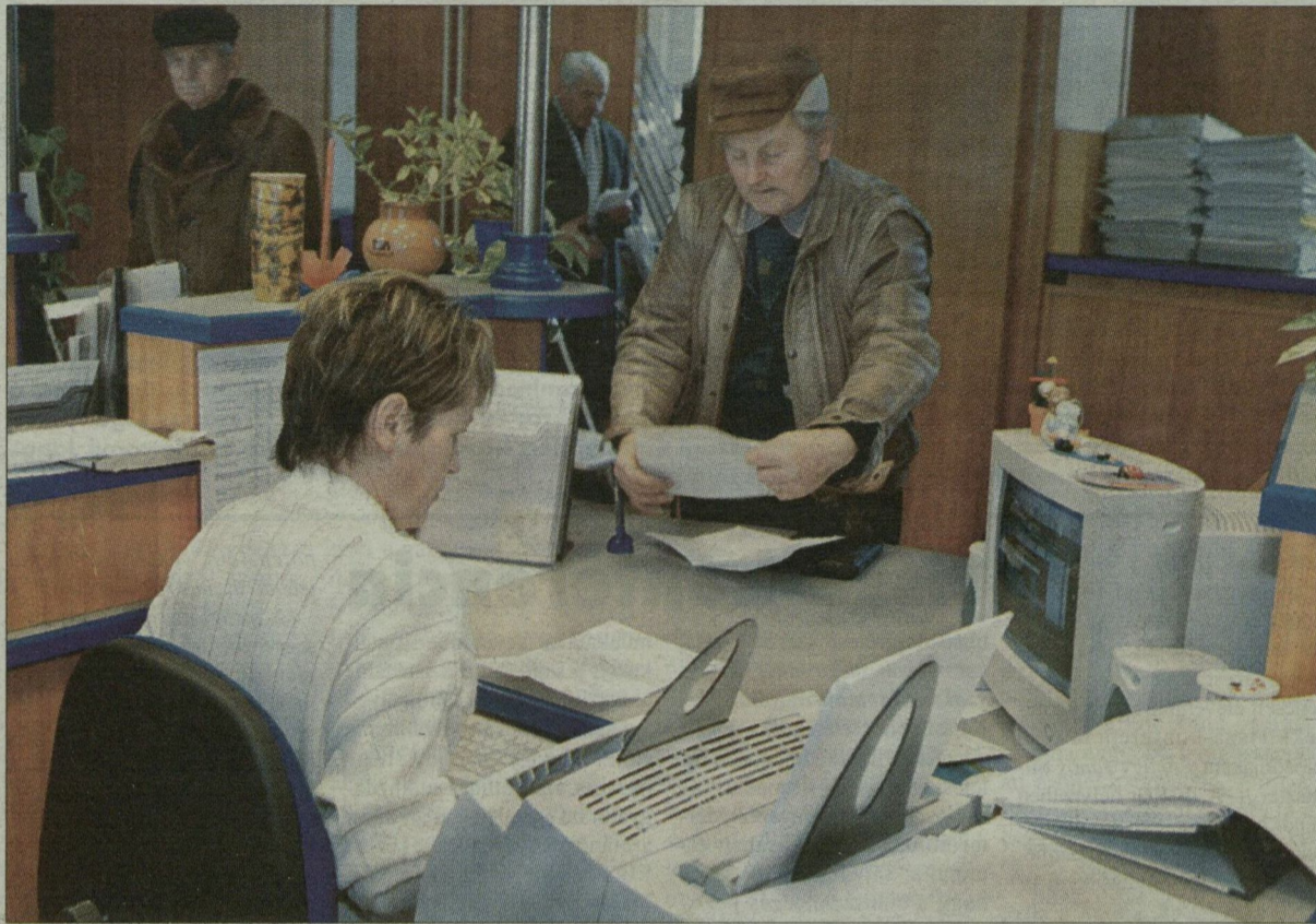
Egyenlegmagyarázat. Teljes a tanácsalanság az ügyfélszolgálaton.