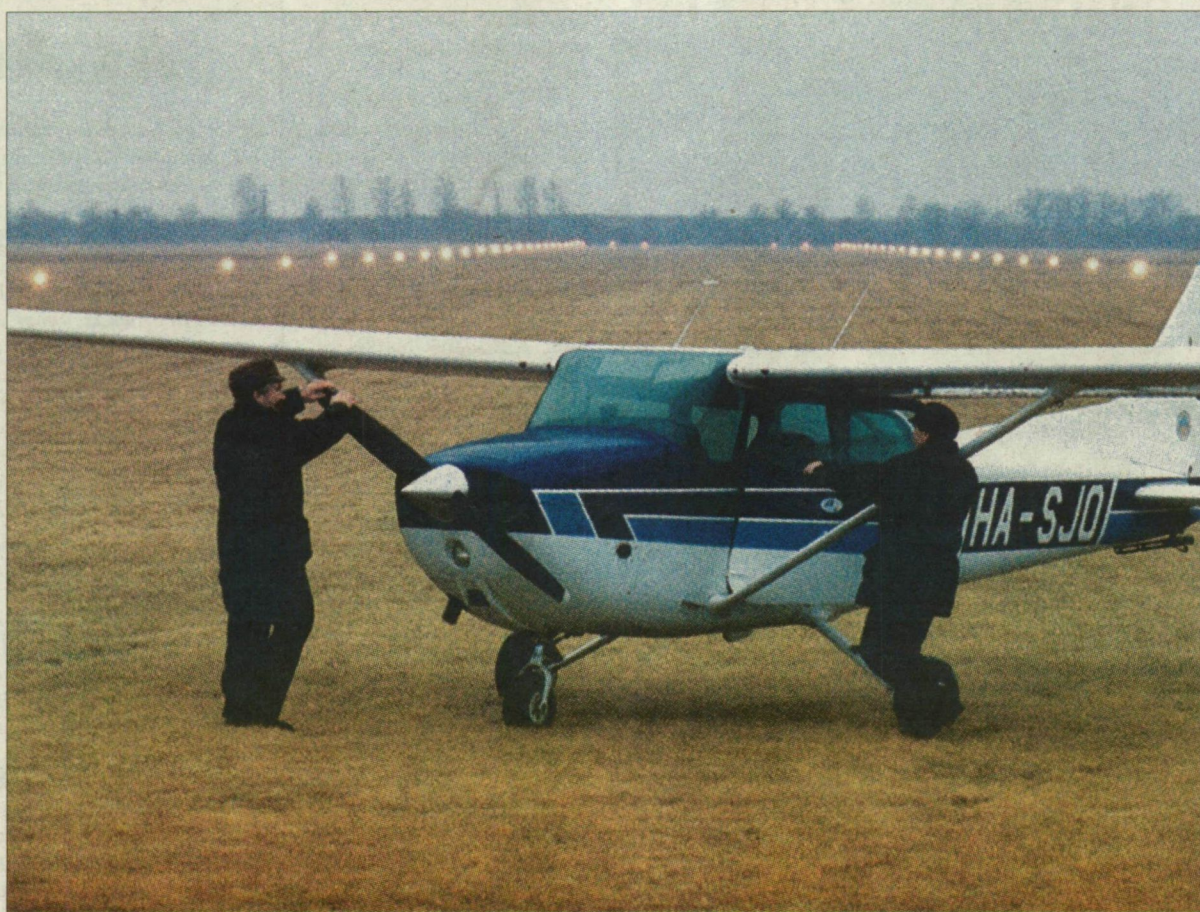
Mi indul be, a privatizáció, vagy a regionális légi közlekedési csomópont fejlődése?

A győriek örülhetnek, adta tudtul olvasóinak a Kisalföld hétfői számában, mivel 2,2 milliárd eurót, félmilliárd forintot nyertek Phare-támogatásként a repülőtér fejlesztésére, a maguk félmilliárdja mellé. Debrecen kapcsolt a legkorábban, a '90-es évek elején, amikor egy talicska kárpótlási jegyért megsze-