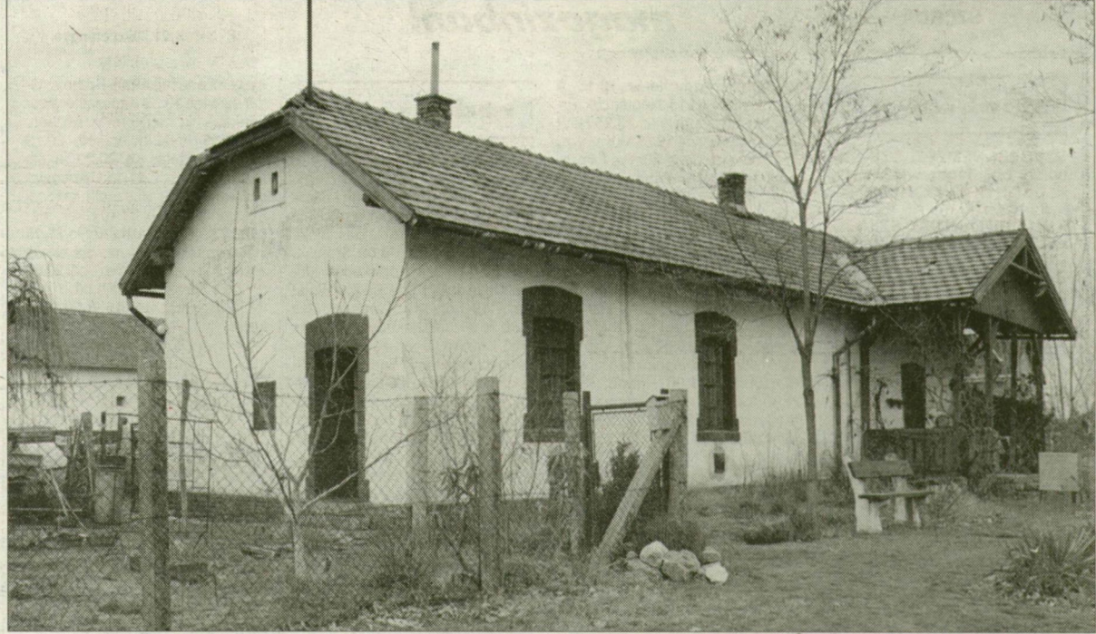
Az öreg állomás épületében vasúttörténelmi múzeumot rendeznek majd be.