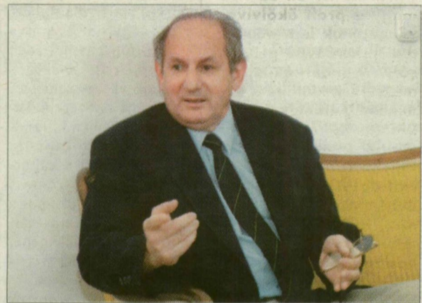
Dr. Mészáros Rezső rektor: Az egyetem jövője függ attól, javítjuk-e a hallgatók körülményeit.

– Ezzel kapcsolatban megoszlanak a vélemények. Szerintem az átmeneti évről alaptalan félelmek miatt döntöttek, és az inkubációs időszak inkább ártott, mint használt az integrációnak. Elodázta azokat a döntéseket, amelyeket nem lehet elkerülni, és egy évre konzerválta a régi rendszer bizonyos elemeit. Emiatt a kelle-ténél lassabban indult el és történt meg az egységes gazdasági rendszer kialakítása, nehézkesebben kezdődött el a közös stratégiai gondolko-