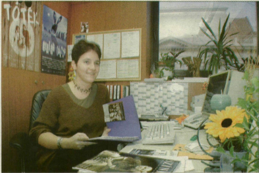
Plakátok között, a színház irodájában.

– Szegeden születtem, gyerekkoromban szinte minden nyarat a szabadtérin töltöttem. Ennek ellenére a képzőművészet sokáig jobban érdekelt, jól is rajzoltam, de végül mégsem azt az utat választottam, hanem angol-olasz szakos bölcsész lettem. Egyetemistaként részt vettem Bodolay Géza színház-zal kapcsolatos kurzusán, amelynek kapcsán végigkísérhettük az Egy pohár víz című Scribe-darab színrevitelét az olvasópróbától a bemutatóig. Megszerettem ezt világot, rendszeresen bejártam próbákat, előadásokat nézni. Angol nyelvű szakdolgozatomat is színházi témából írtam: Shakespeare bohócfigurái a magyarországi előadások tükrében. Sok energiát fektettem bele, a Színház-történelmi Intézetben végeztem kutatásokat, rengeteg előadást megnéztem előben és videóról. Az államvizsgámat követő napon megláttam a Délmagyarországban a színház hirdetését, amelyben művészeti titkárt kerestek. Rögtön jelentkeztem, de az állást addigra már betöltötték, ajánlottak viszont egy másikat a szervezési osztályon, a Kárárs utcai jegyirodában. Két éven át dolgoztam ott, majd