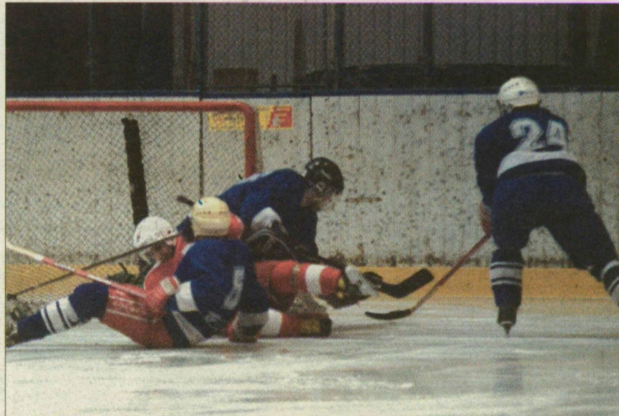
Egy jellemző jelenet a Tisza Volán-Dunaferri jégkorong-mérkőzésen: munkában a szegedi védelem.

A mérkőzés elején pillanatok alatt tűz alá vették Lajkó kapuját a vendégek, s az első harmadban hat-szor mattolták a volános hálórt. A második és harmadik húsz percben is folytatódott a macska-egér harc, s a végén a Dunaferri 15-0-ás győzelmet könyvelhetett el.