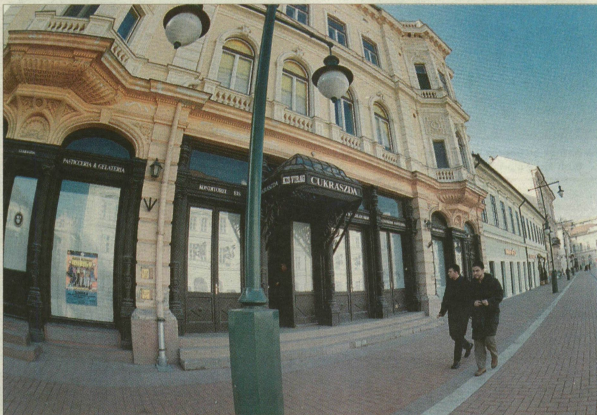
Még mindig nem nyílik a Virág: egyelőre nem látni, mi folyik a kulisszák mögött!