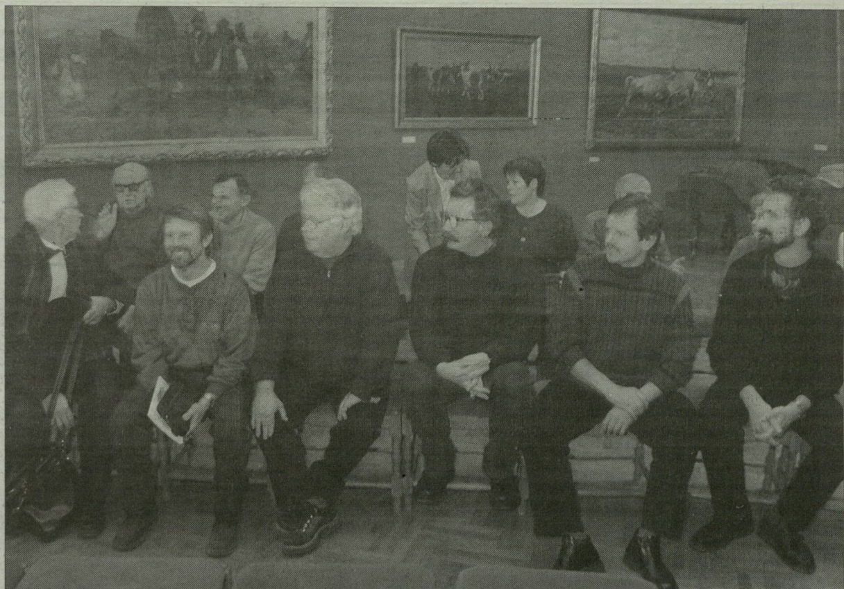
Csak ülnek és néznek...