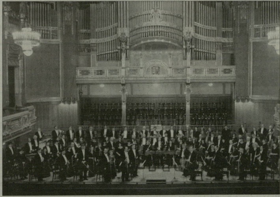
Filharmonikusok a Zeneakadémia nagytermében.