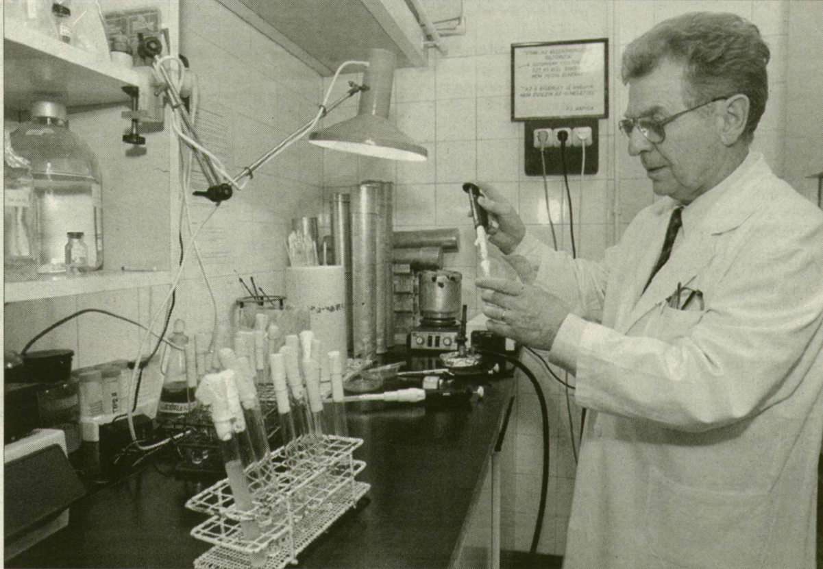
A szegedi orvosegyetem mikrobiológiai intézetében Molnár professzor 20 éve kutatja a ráksejtek „viselkedését”.

– A ’90-es évek elejétől a daganatsejteknek azt a típusát kezdtük vizsgálni, amelyek nem érzékenyek, s nem reagálnak a rákellenes gyógyszerekre. Azt kutattuk, hogy mivel lehetne megakadályozni a hagyományos kemoterápiás szerekkel nem gátolható tu-