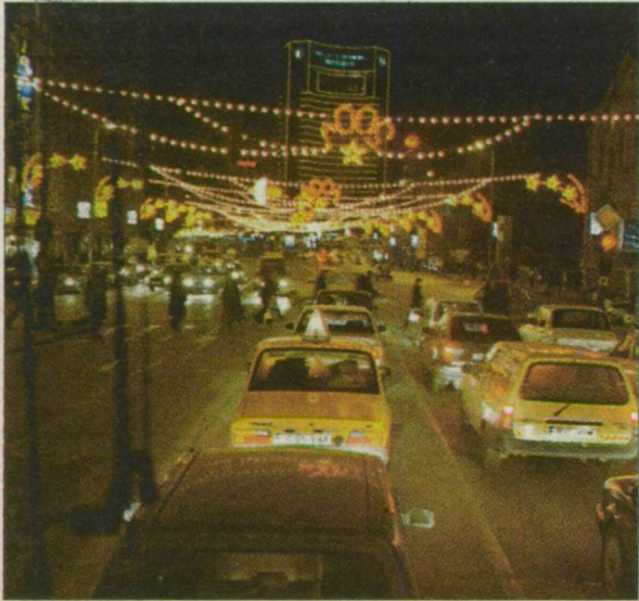
Éjszakai Bukarest. Reggelre eltűnik a fény és látható lesz a valóság...