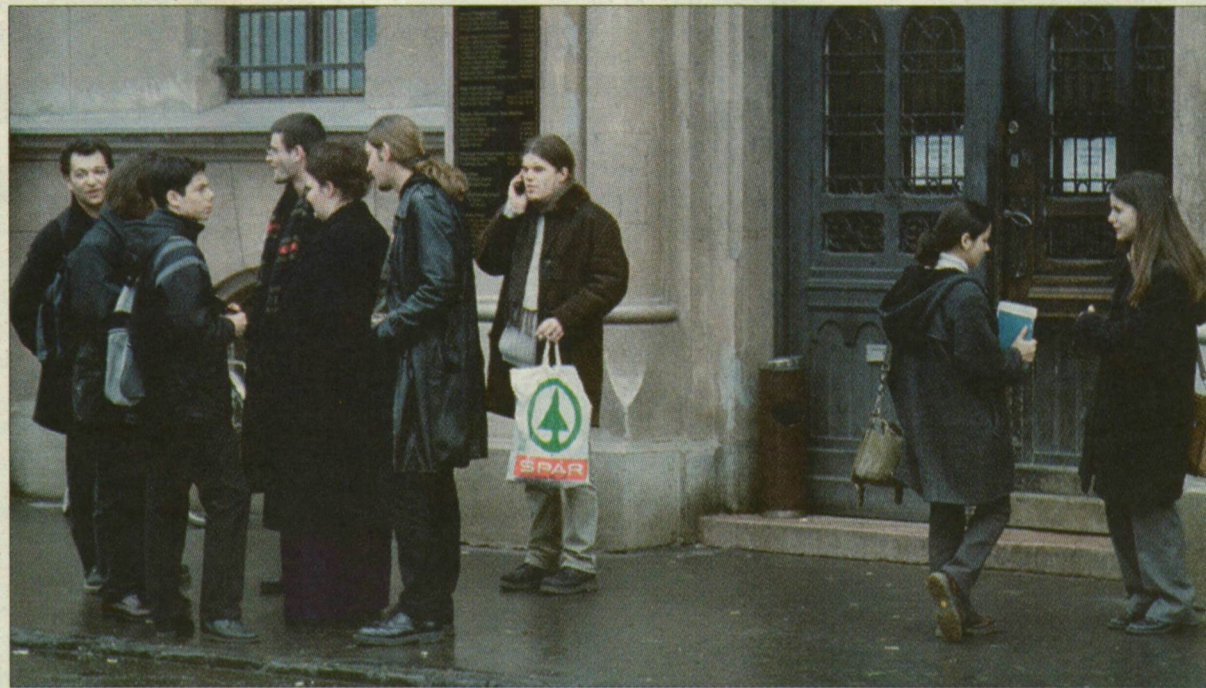
Hallgatók a bölcsészettudományi kar épülete előtt. Az integráció sem az intézmények működésében, sem az oktatásban nem okozott zavarokat.