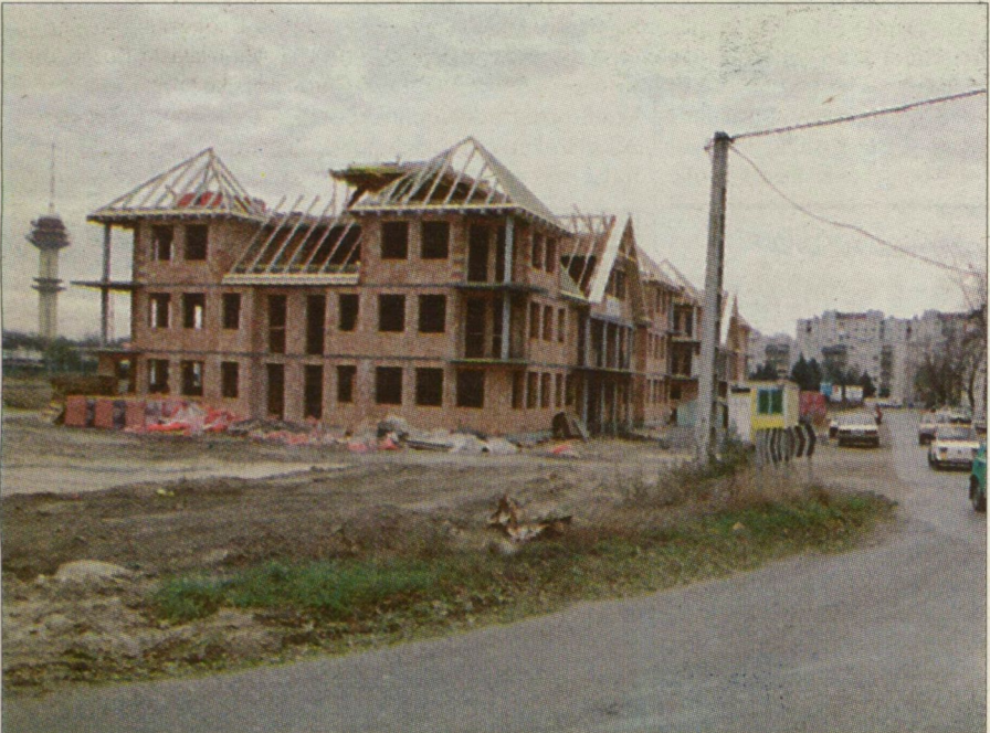
Új lakónegyed épül Szegeden. Házakat építenek a Franciahögyön.