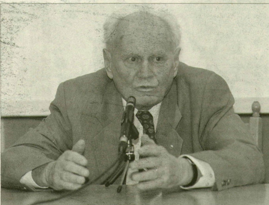
Göncz Árpád: Semmi olyat nem mondtam, amit nem gondoltam igaznak.

– Ezzel nem elsősorban az én személyes döntésemet bírálta felül, hanem a kegyelmi jog