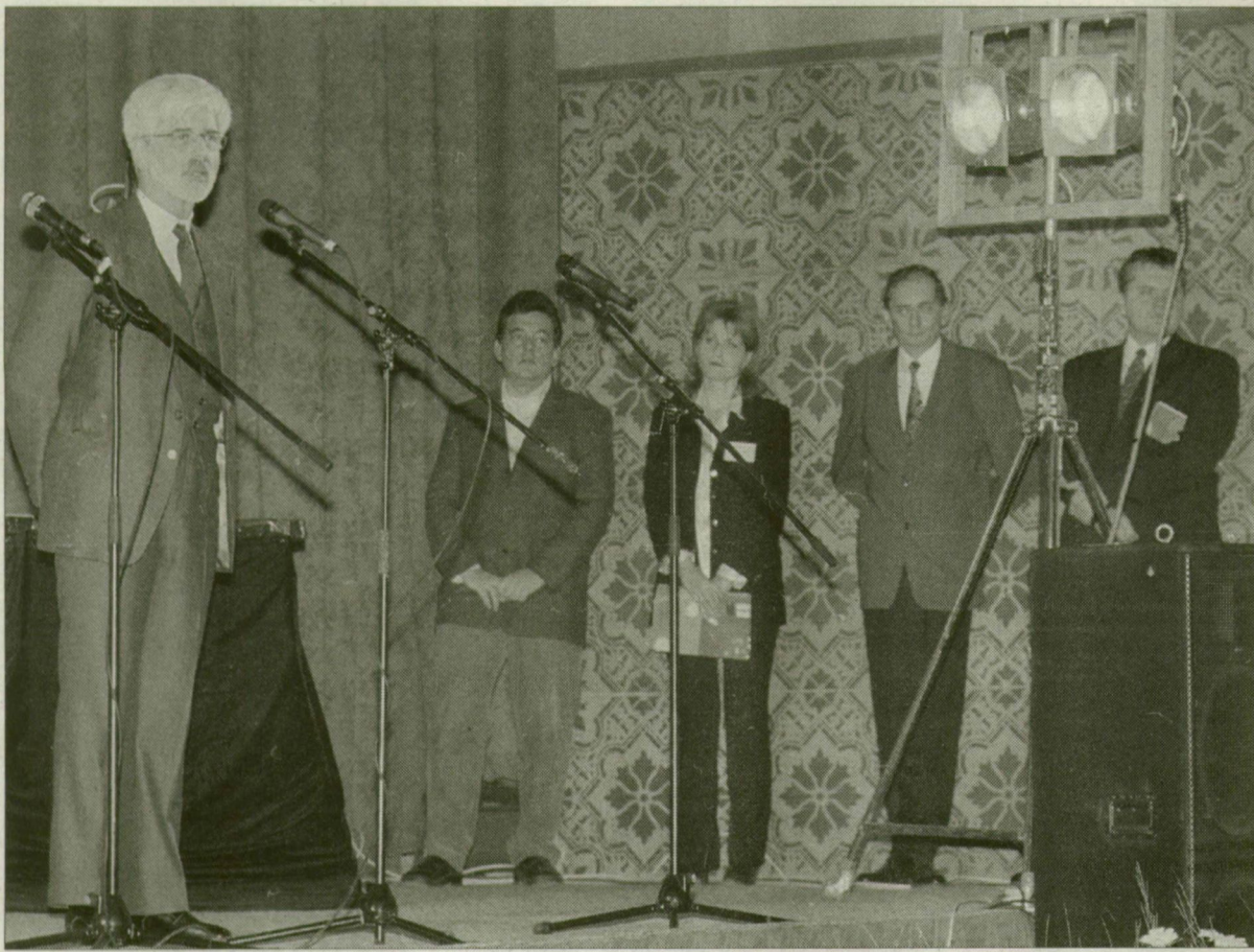
Gazdag Gyula: „A fesztivál jó alkalom a párbeszédre”.

Az idén második alkalommal rendezik meg a Kamera Hungária elnevezésű tévéfesztivált, amelynek először ad otthont Szeged. A tegnapi megnyitón Gazdag Gyula filmrendező a párbeszédre való alkalomként jellemezte a televíziósok találkozóját, amelynek gazdag programjaira a közönséget várják.