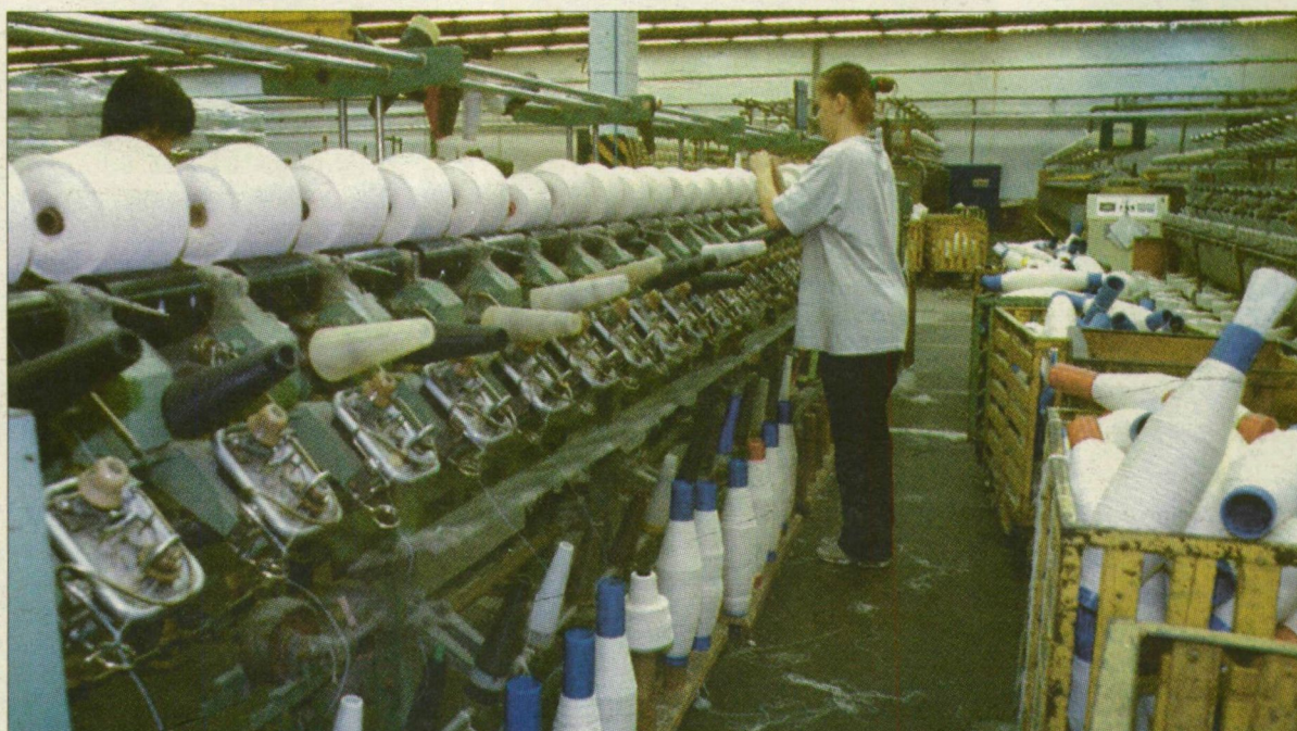
Heavytex, mint a könnyűipar egyik utolsó bástyája. Nem húzóágazat.