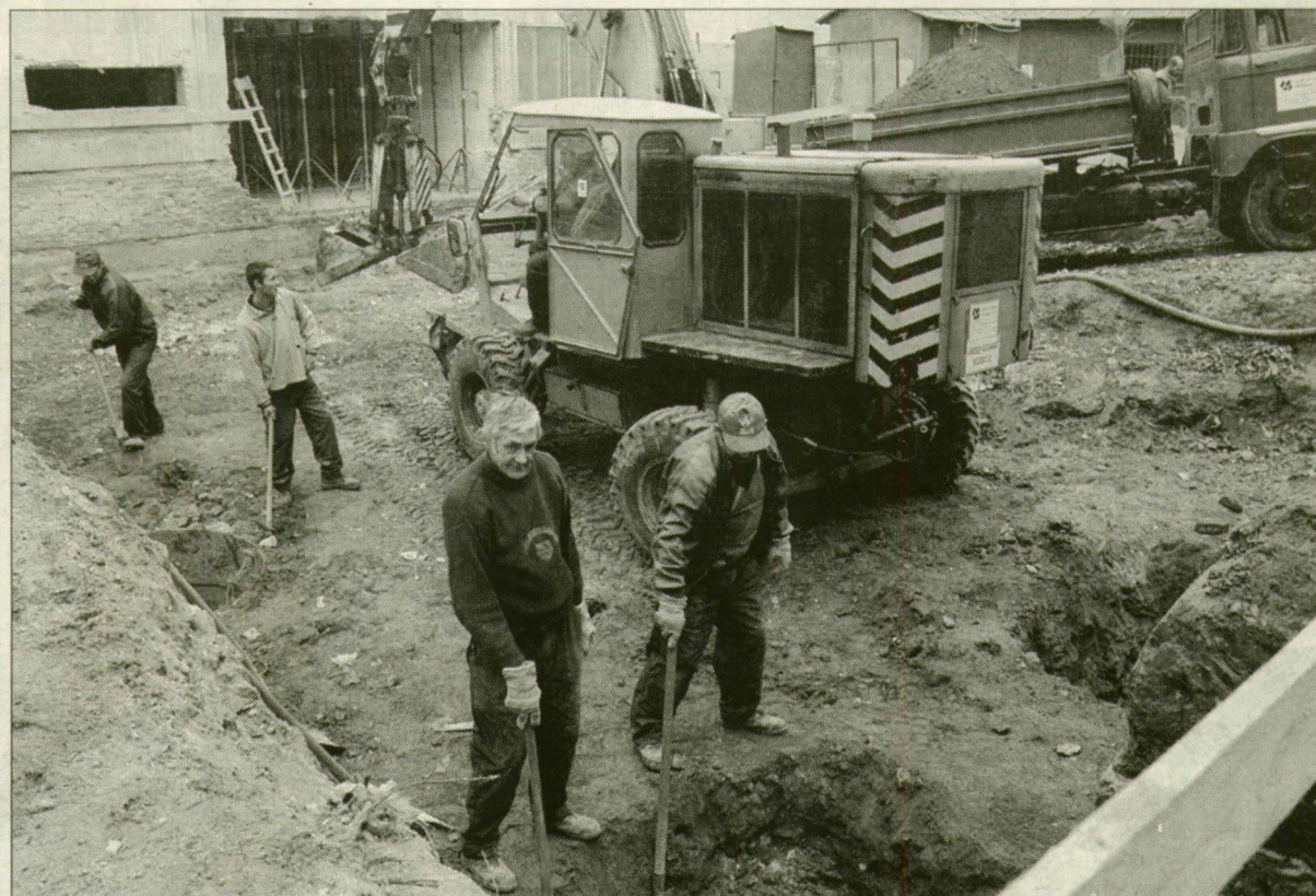
A szegedi onkoterápiás klinika szomszédságában, 90 millió forintos beruházással épül az a betonbunker, ahol a legújabb sugárkészülék kap helyet, várhatóan jövőre.