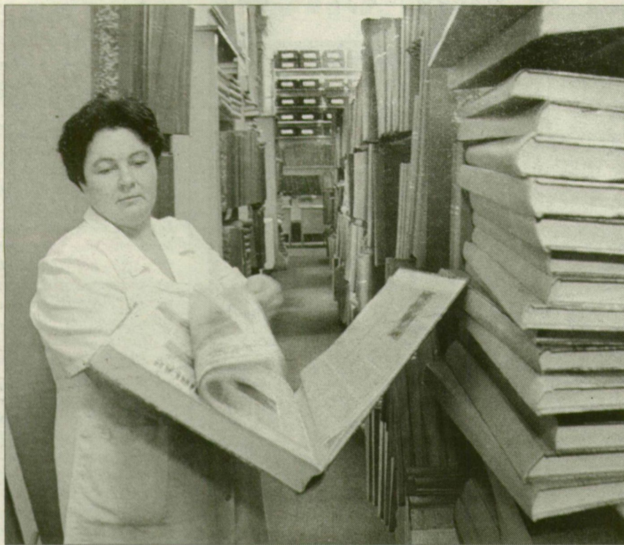
Az egyetemi könyvtárnak a világbanki hitelből épülő új információs és tanulmányi központba költöztetésével megszűnik a jelenlegi zsúfoltság.

A fejlesztéseket három ütemben készítették elő: elsőként az intézményfejlesztési, majd a beruházási terveket állították össze, ezt követően keret-megállapodást írtak alá