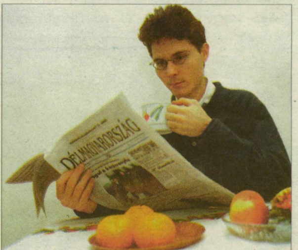
Lékó Péter lehet, hogy a legszívesebben a vb-ről szóló tudósításokat olvasná már a Délmagyarországban?