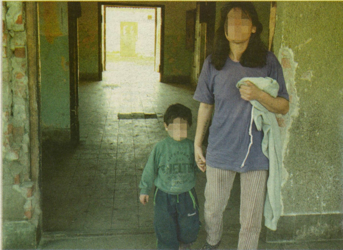
Igazságok és igazságtalanságok, jogos és jogtalan indulatok – sorsok.