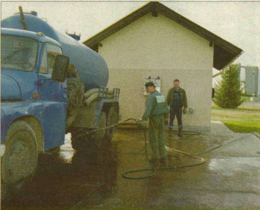
Öt év múlva már nem lesz szükség szippantókocsira a városban.