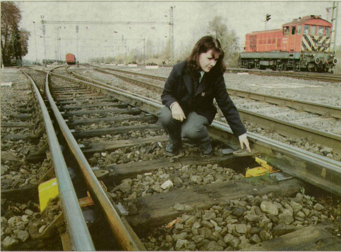
A kiskundorozsmai állomásra több is jutott ebből az új, modern berendezésből.

A környezetet károsító anyagok kiküszöbölése végett a MÁV Rt. új, korszerű váltóelemeket szerelt fel az ország számos állomásán a kiterőkre.