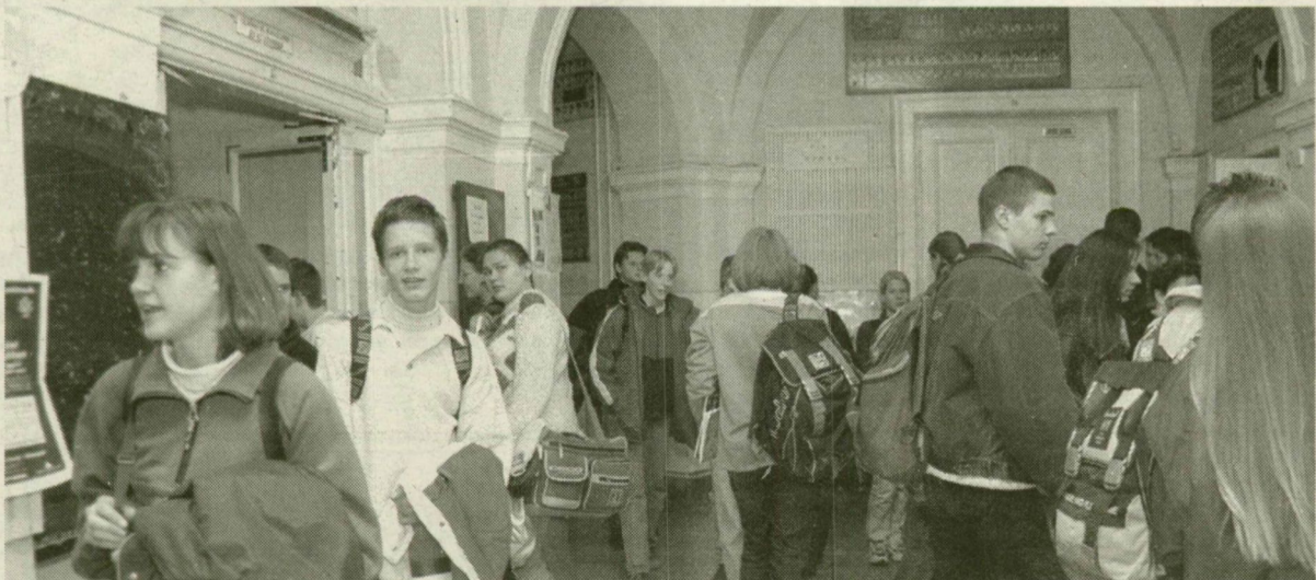
Az új pályázati pénzből felújítják majd a Radnóti földszintjét és két emeletét is.

tervezett tornacsarnoka felépüljön és a felújítás is folytatódjék.