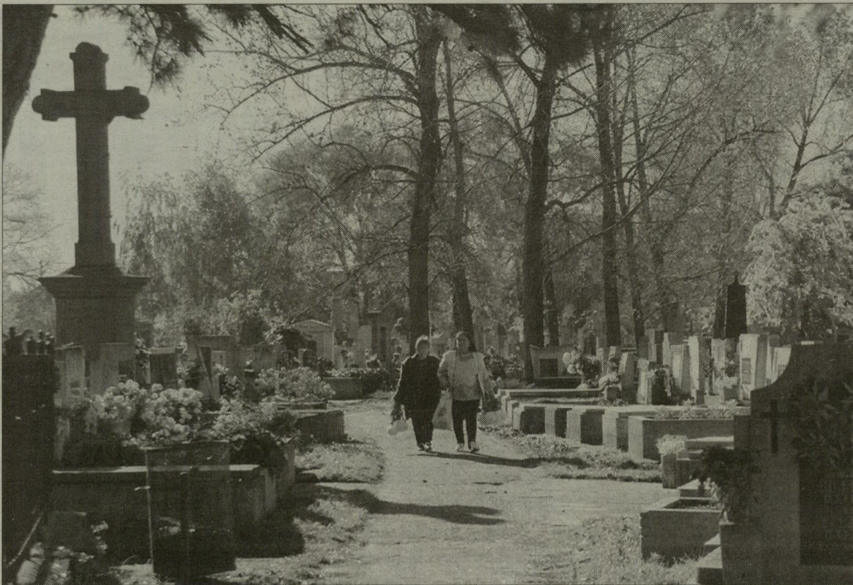
Mindenszentek és halottak napján, mintegy százezer embert várnak a temetőkhöz. (Schmidt Andrea)