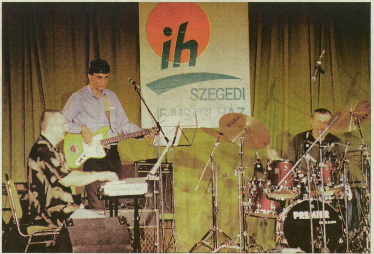
A legendás PRT „alapjaira épült” Hot Line közönségikert is arathatott volna.