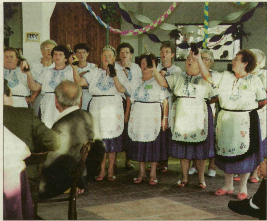
A házigazda Kübekházi Asszonykórus is hatalmas tapsot aratott.