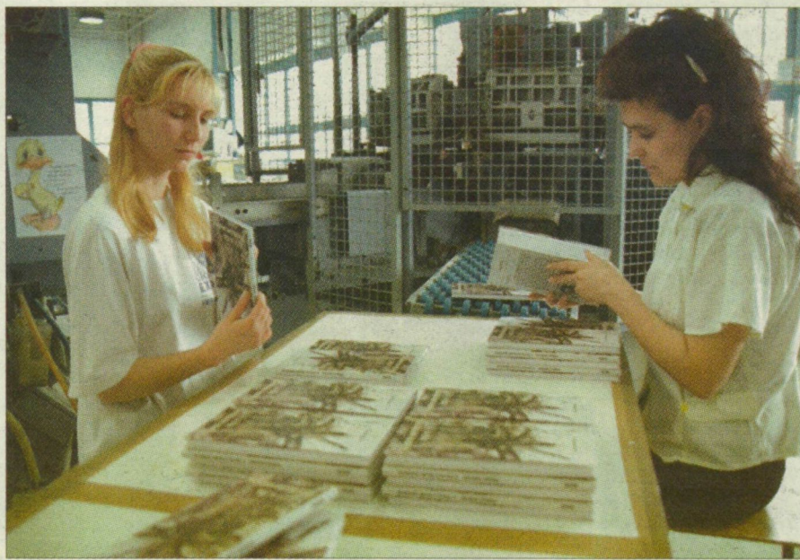
Nyomdában. Szép munka, kiugró növekedésre mégsem számíthat az iparág.

Sajnos, Csongrád megye többnyire kimaradt a '90-es évekből. Bizonyíték erre, hogy miközben 1992 óta a megye csupán nyolc százalékkal tudta csak növelni ipari termelését, addig az ország 70 százalékos bővülést ért el. (A megyeszékhely ipartörténetének legfrissebb szomorú fejezete a ruhadarab feldolgozóipar, de a gyufagyárból