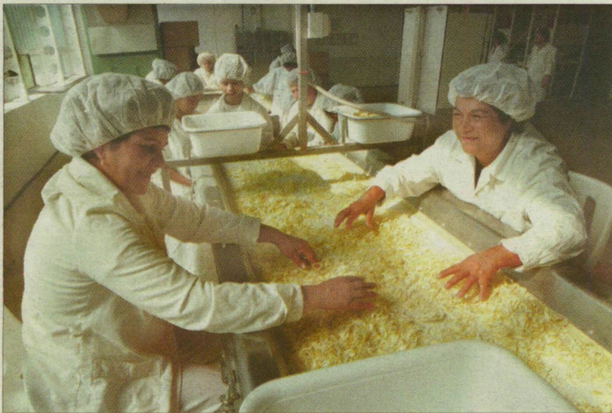
Hagymaszárító. Az élelmiszeripar fejlődési potenciálja véges.