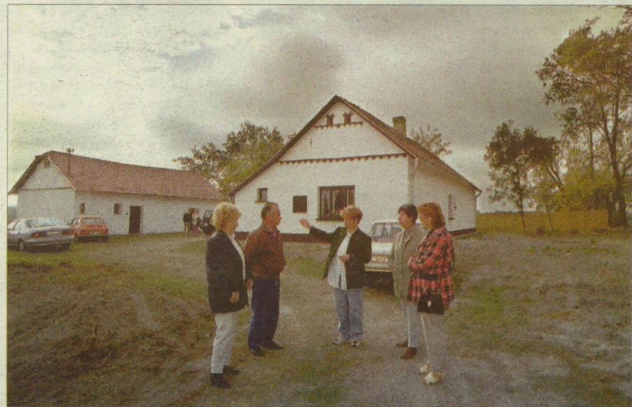
Az ásotthalmi tanya olyan, mint a többi alföldi otthon, csak éppen nem gazdálkodásra, hanem vendégfogadásra alakították.

(A témára a Kitekintő oldalunkon később visszatérünk!)