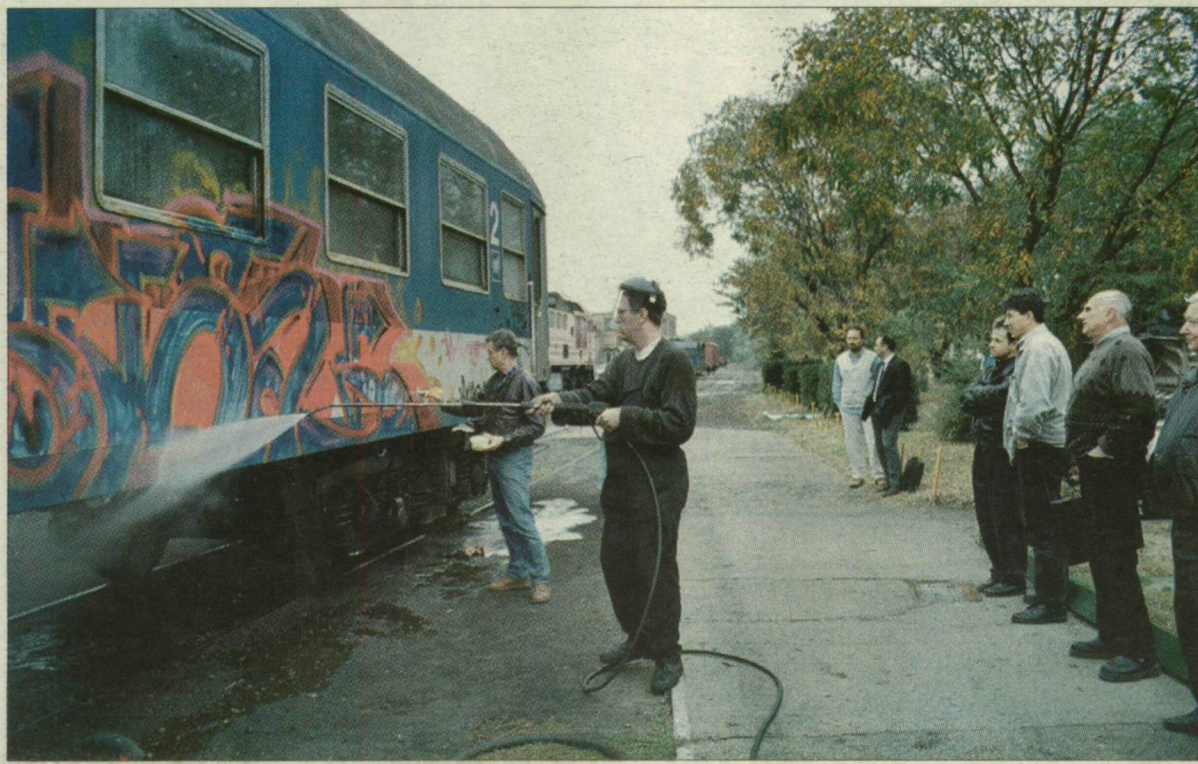
Egy vasúti kocsi a szakemberek szeme láttára tisztult meg a firkáktól. Néhány ezer még hátravan.

Ez az idő Magyarországon még nem érkezett el, pedig már itt vannak azok a tisztítószerek, amelyek például a svéd és a német államvasutak járműveit szabadítják meg a firkáktól.