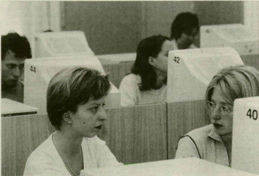
Az Irinyi-kabinetben a diákoknak olykor várniuk kell, amíg felszabadul egy-egy gép.

A tanárképző főiskolai karon lévő számítógépes termek közül jelenleg három használatban van a hallgatók, akik a számítástechnika szakos diákok kötelező gyakorlati kurzusain kívül egy héten összesen mintegy 90-95 órán keresztül vehetik igénybe a gépeket. – Minden korlátozás nélkül használhatják a számítógépeket, és azok is bejöhettek hozzánk, akik más karo-