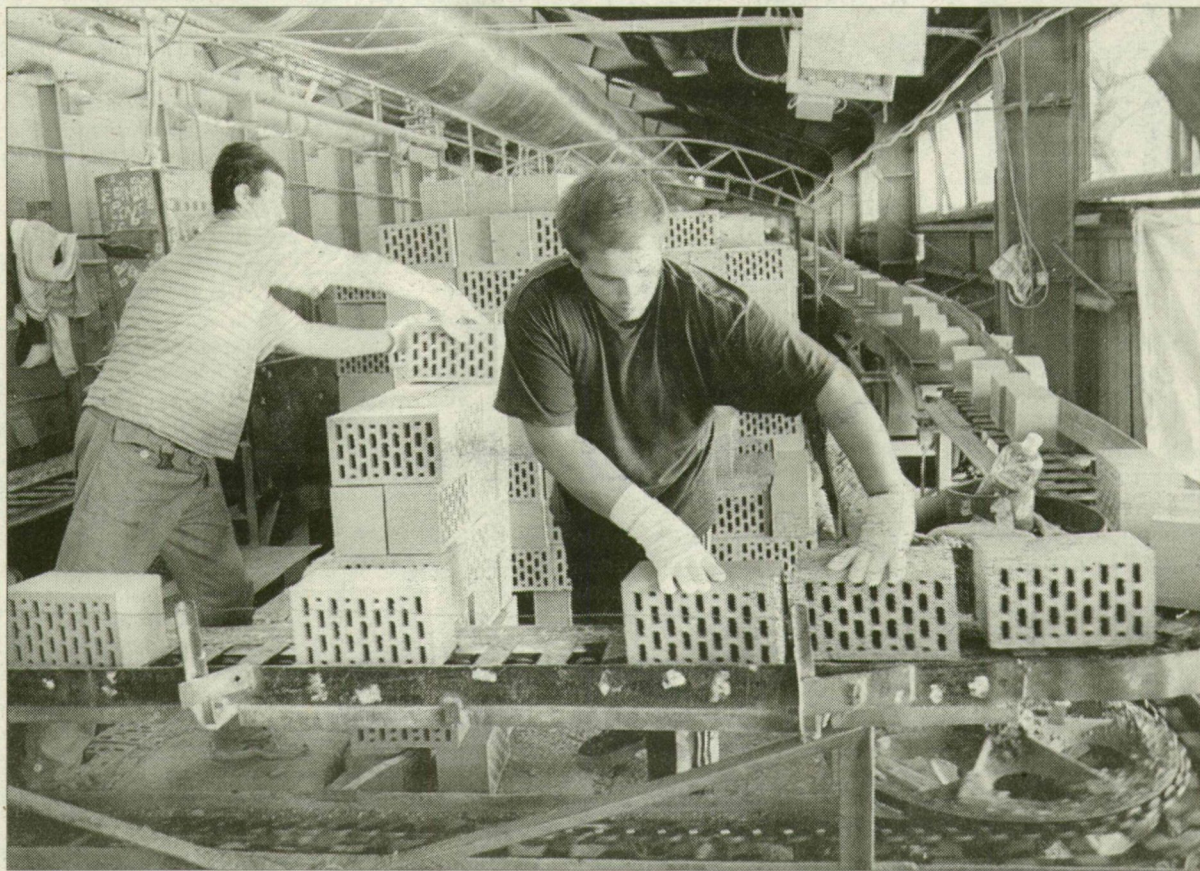
Tisza téglá: tizenötmillió darab évente. A szegedi termék idegenben talál gazdára?