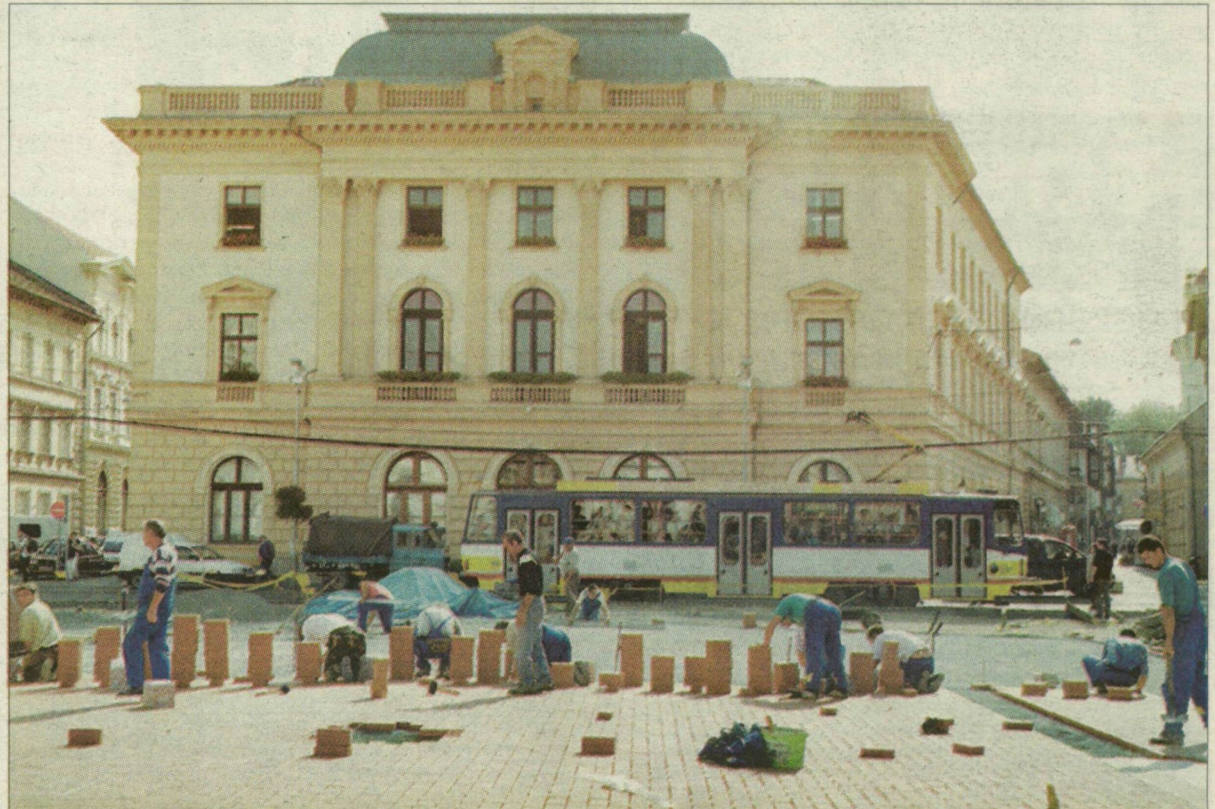
Vörös és fehér díszteglák a régi, bokaficamító kőköcsök helyén: teljes „frontszélességben” rakják a szegedi Klauzál tér díszburkolatát.