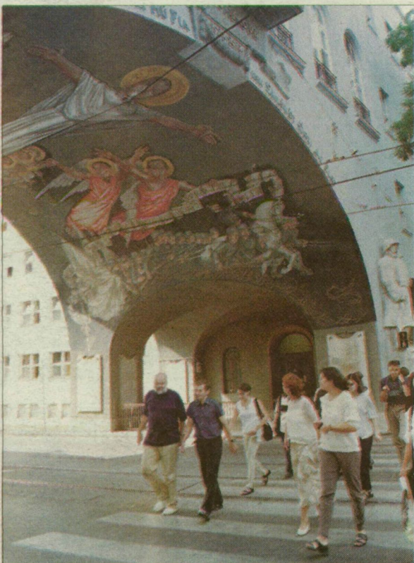
Az Aba-Novák-freskó eszmei értéke szerint többet ér, mint az épület, amelyen található.

Szeged hetven év után visszakapta Aba-Novák Vilmos fallfestményét az első világháborús szegedi áldozatoknak emléket állító Hősök kapuja nagyboltjívén. A közönség és a műértők egyöntetű véleménye, hogy a freskó restaurálása kitűnően sikerült, a mű megőrizte régi művészi erejét. Tóth Attila művészeti író, a Szeged szobrairól szóló sikeres album szerzője úgy véli, a helyreállított fallfestmény a város egyik új jelképe lehet. Tóth Attila sz-