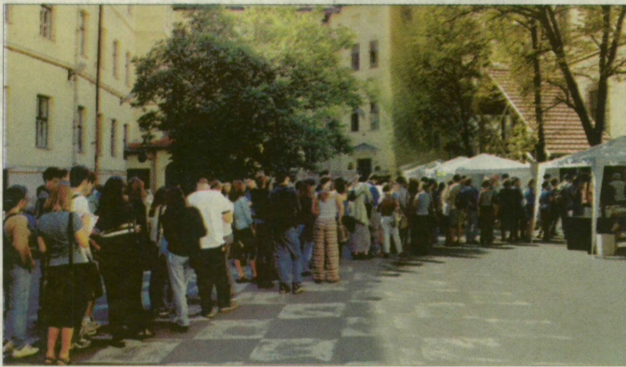
A hallgatók a szolgáltató irodában könyvcsekket, valamint tömegközlekedési bérletet kapnak háromnegyed órá „kigyózás” után.