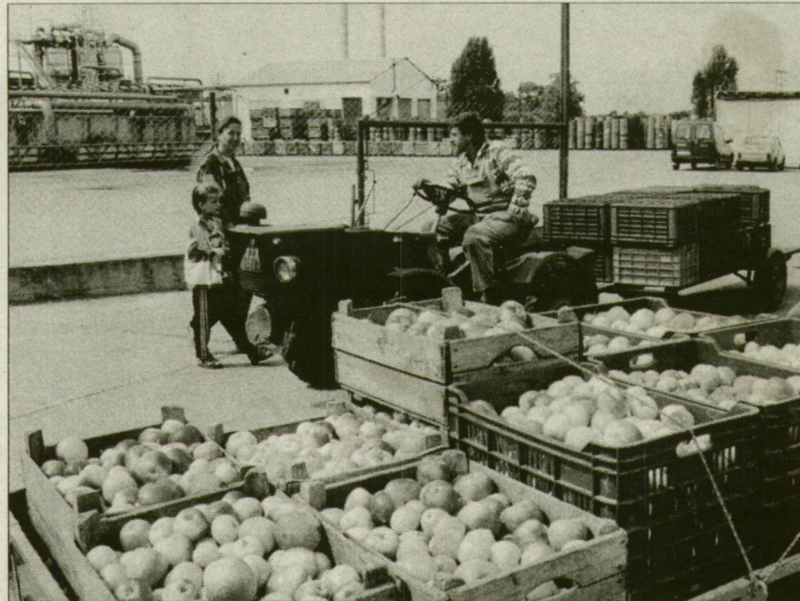
Gyümölcsstermesztők találkozója a kapuban. Az alma is levet ereszt.

A kapun egy bordányi kistermelő már üres ládákkal jön ki, s traktorát is leállítja kedvéért. Így megtudjuk, tíz mázsa léalmát hozott, s a kilonkénti 20 forintot hatvan napos fizetési határidőre ígérte az átvevő. Más választásuk nem nagyon lehet, idén