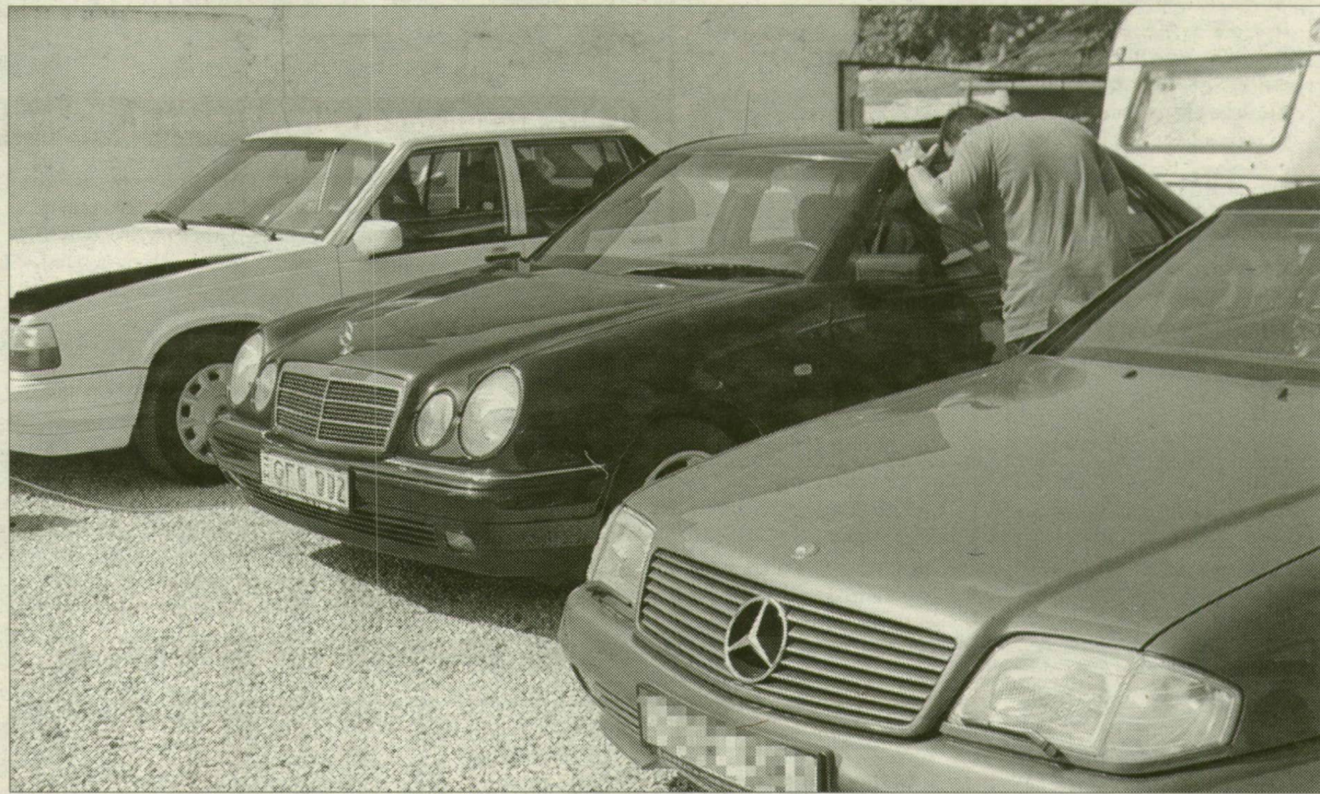
Használtautó-telep. Jövőre a koros kocsikra nem szednek vámot?

A január 1-jén megszűnő vám valójában egy hat esztendeje tartó folyamat végeredménye. Az Európai Unió társulási egyezménye ugyanis előírja, hogy 1995. január 1-jétől, hat év alatt folyamatosan meg kell szüntetni a vámtartó bizonyos termékekre. Természetesen ebben a kategóriába tartoznak az Európában gyártott személygépkocsik is. Egy átlagosnak mondható, 1600 köbcentis autót hat éve még 13 százalékos vám terhelt, idén augusztusig ez az érték 1,95 százaléka zsugorodott. Igaz, mindebből a vásárló semmit sem vett észre, hiszen az új autók ára az elmúlt hat esztendőben szinte robba-