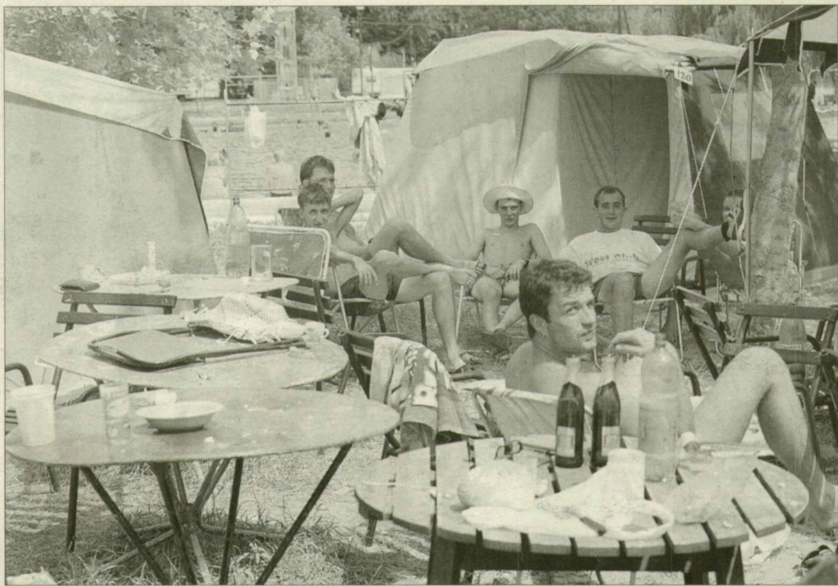
Aki mégis ide jön, jól érzi magát. A hajósi West-klub tagjai a kempingben.

Néhány hete felpézsdült a partfürdőn levő kemping élete. A jugoszláv regattalálkozóra 56 kishajón mintegy kétszázan érkeztek Újszegedre. A három napnak azonban gyorsan vége lett, a társaság odébált. Első pillantásra úgy tűnik, az élet megállt a Tiszaparton. A száмок azonban mást mondanak.