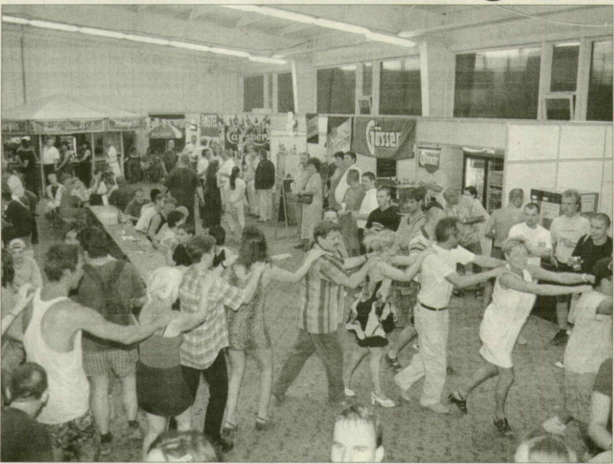
Éjszakai hangulat a szegedi sörfesztiválon. Nincs kiszállás.

Tegnap este Balázs Pali koncertje után néhány órával elzárták a kapukat és bezárták a kapukat a nyolcadik szegedi sörfesztiválon. A hatalmas tömeget mozgató öt-napos fiesta mára az ország második legnagyobb rendezvényévé vált.