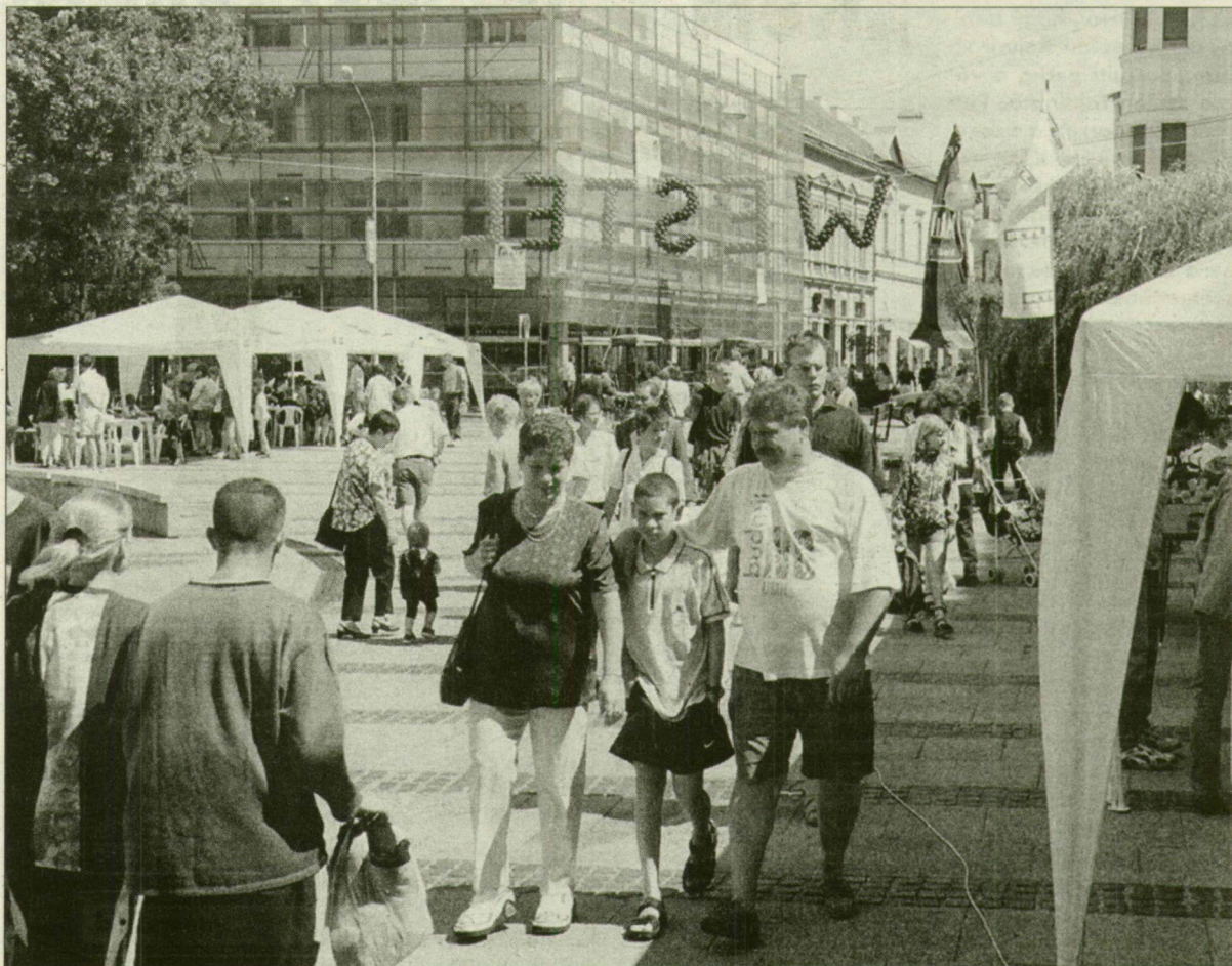
Jó programok garantálták a sikert szombaton.

Több ezren voltak kíváncsiak a záróprogramra, ami mindössze 10 perccel csúszott 22 óra utánra. Ezzel együtt a szervezők köszönik a környéken lakók megértését a szokásosnál