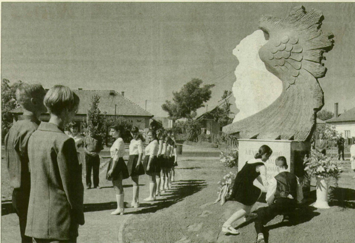
Az emlékmű Kalmár Márton munkája. (Fotó: Miskolczi Róbert)

Égész napos búcsút rendeztek tegnap Balástyán, melyen egymást váltották a műsorok korra reggeltől kezdve egészen hajnalig. A különféle műsorok, bemutatók mellett felavatták a település főterén álló második világháborús emlékművet, valamint átadták a megyezászlót.