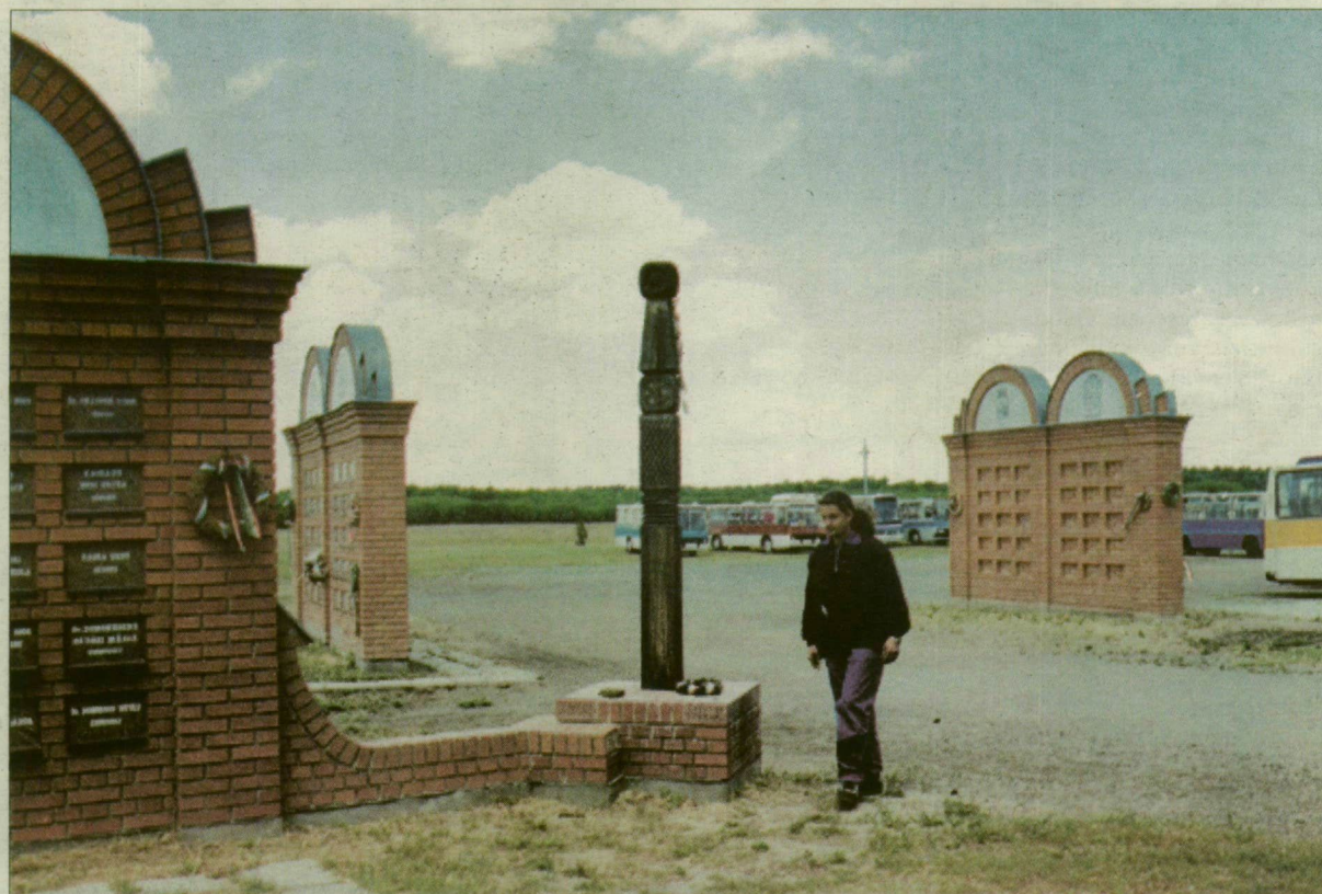
Az engedély nélkül épített Megmaradás falából öt elem szinte biztosan „megússza” a lebontást.

A Kiskunsági Nemzeti Park igazgatósága is eredménytelenül küzdött – ugyanakkor talán nem kellő erővel –