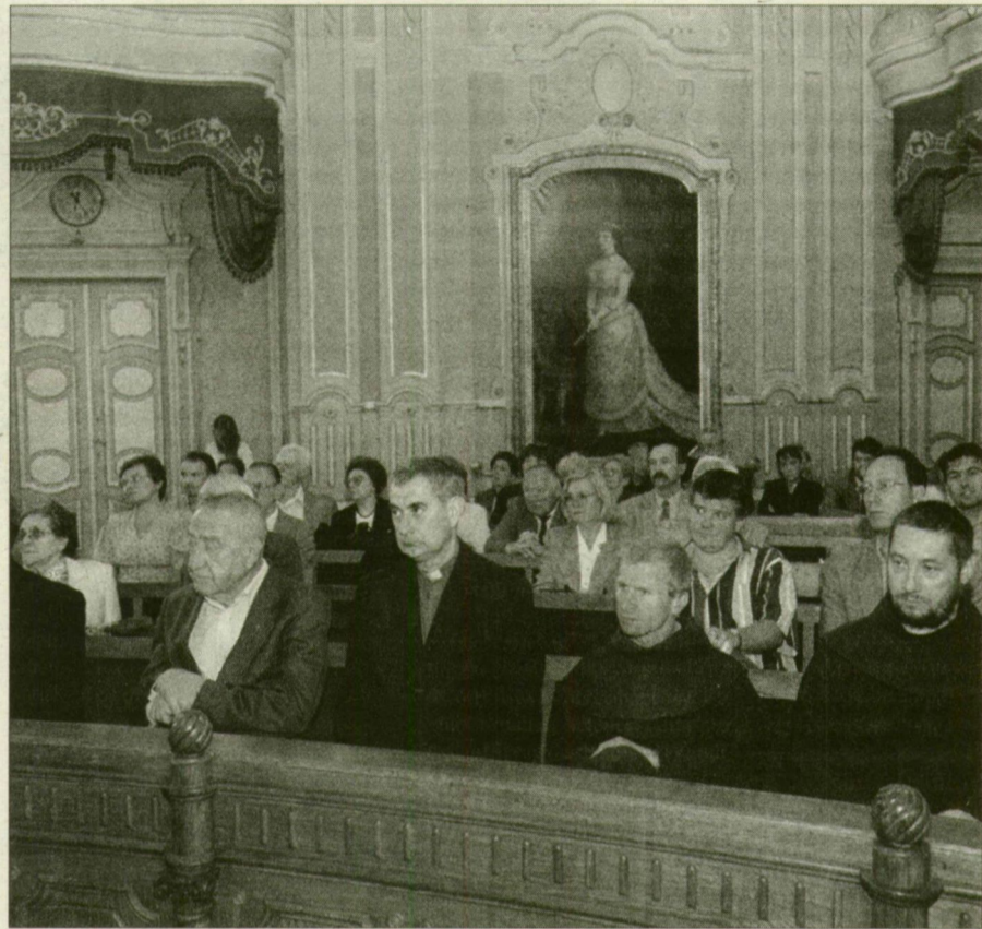
A keresztény értelmiség érdekelt a kormányzati családpolitika sikeres folytatásában – derült ki a tegnapi városházi fórumon.

Áder János szerint igaztalan kritikák érték a kormányzatot, amikor a 7 százalékos GDP növekedést ígérgetésnek állították be, hiszen a KSH múlt havi adatai szerint ez a növekedés megvalósult. Az országgyűlés elnöke e növekedést tartotta a kormányprogram különböző célkitűzései zálogának, mondván, hogy 1-2 százalékos gazdasági fejlődéssel nem lehet az európai átlaghoz való felzárkózást elérni. Áder arra kérte a parlamenti ellenzék véleményalkotóit, hogy most éppen ezért ne a korábbiak ellen kezdjék bírálják a kormányt, a „tűlfűtött” gazdaság növekedésétől tartva.