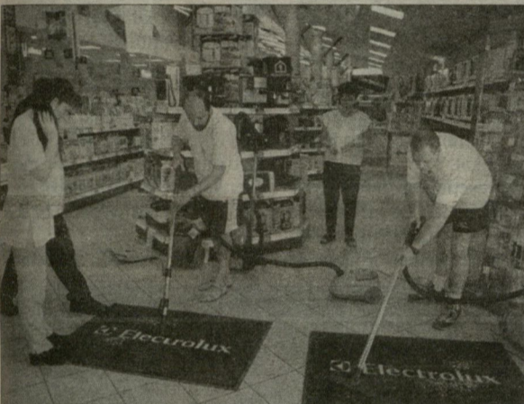
Gazdag az áruházi kínálat.

Tegnap látványos külsőségek közepette kezdődtek a kiállítással és vásárral egybekötött Elektroház-napok Szegeden a Párizsi körút 8-12. alatt, ám a Tescóban levő Elektroház-üzletben is ugyanazzal az árkedvezményekkel és nyereményakkal várják a vásárlókat, mint az áruházban. A hagyományokhoz híven idén is lesznek márkánapok, ám a vásári árak az