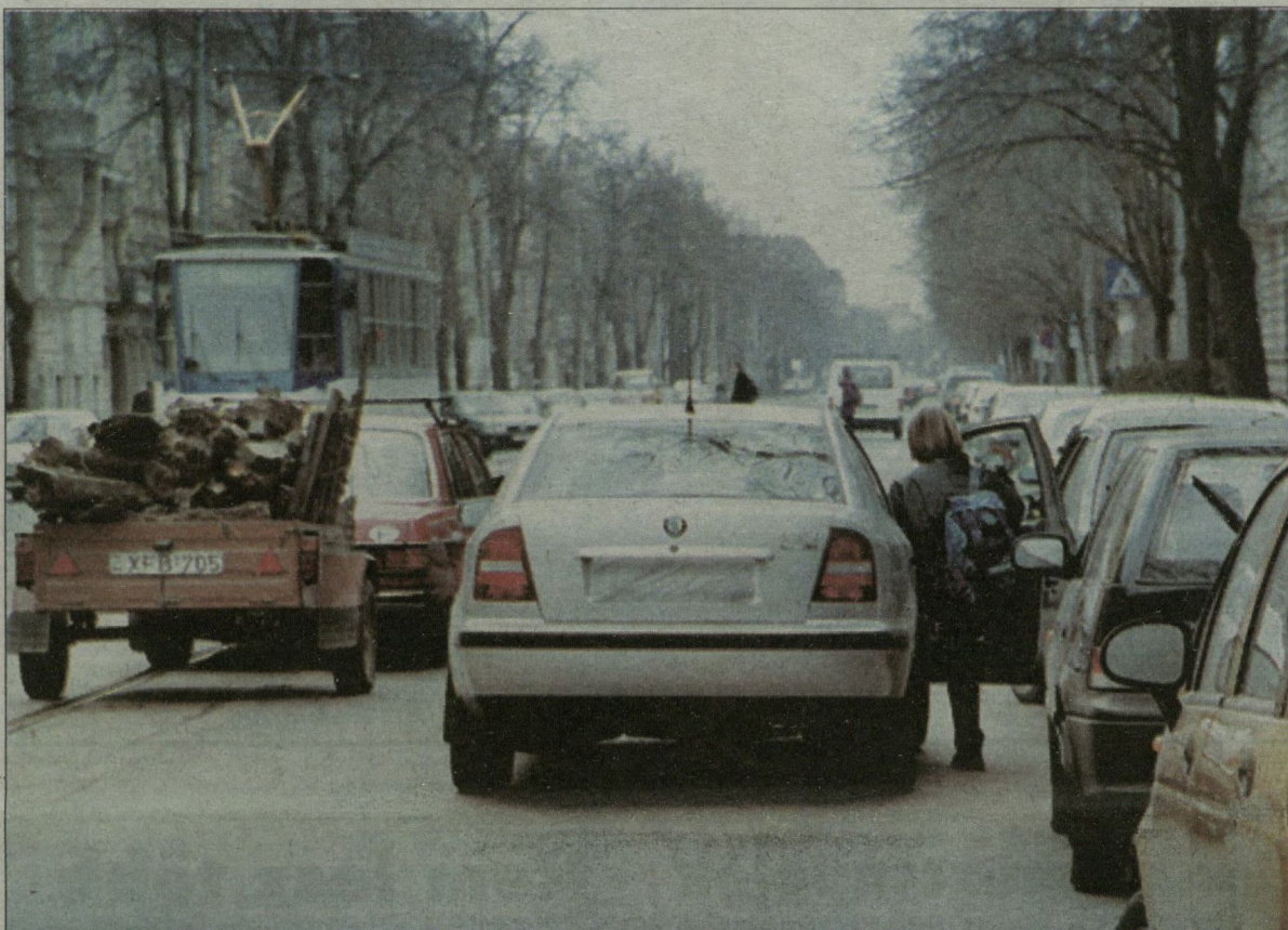
A Boldogasszony sugárúton nem ritka az ilyen jelenet. Csúcsidőben továbbra is csak jeggyel-bérlettel lehet majd megállni az iskolák előtt.