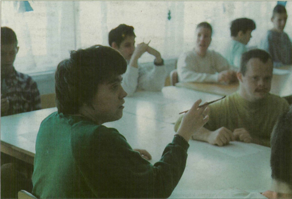
A Waltner gyermekotthon lakói. Merre tovább?

Mint arról lapunkban korábban már beszámoltunk, nemrégiben úgy határozott a képviselő-testület, hogy az év végével megszünteti a Waltner Károly Egészségügyi Gyermekotthonban a négy éve működő nappali ellátási formát. A döntés hét értelmileg sérült kiskorú gyermeket érintett, akiknek a helyzetét azóta sem rendezték megnyugtatóan. (Közülük egy már a gyermekotthon lakója.) Két szülő levelet írt Gönczöl Katalinnak, az állampolgári jogok országgyűlési biztosának, hogy legyen segítségükre nagy bajukban.