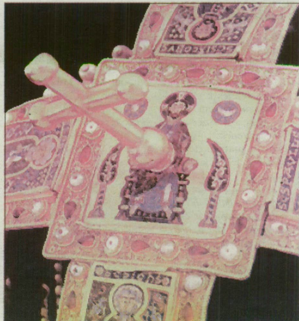
A Pantocrator zománcképe a corona latina-n.