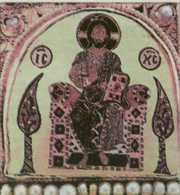
A Pantocrator zománcképe a corona graeca-n.