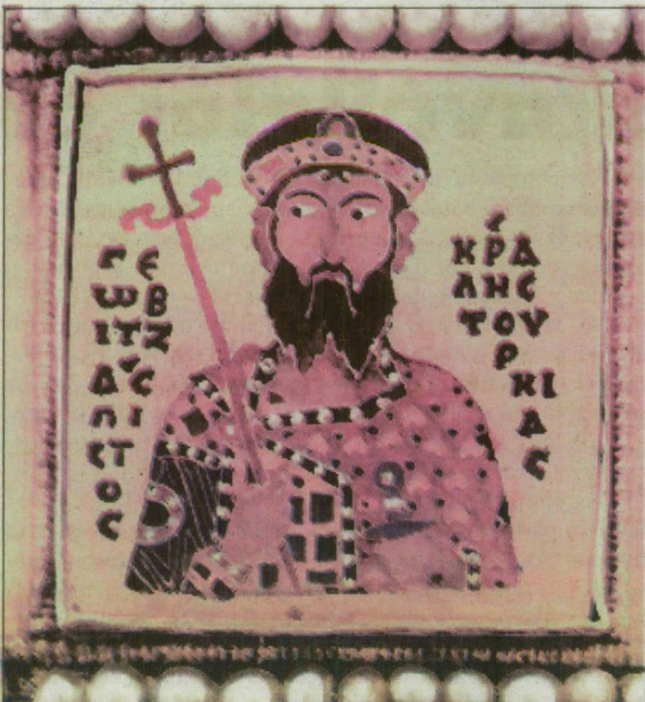
I. Géza magyar király képe a corona graeca-n.