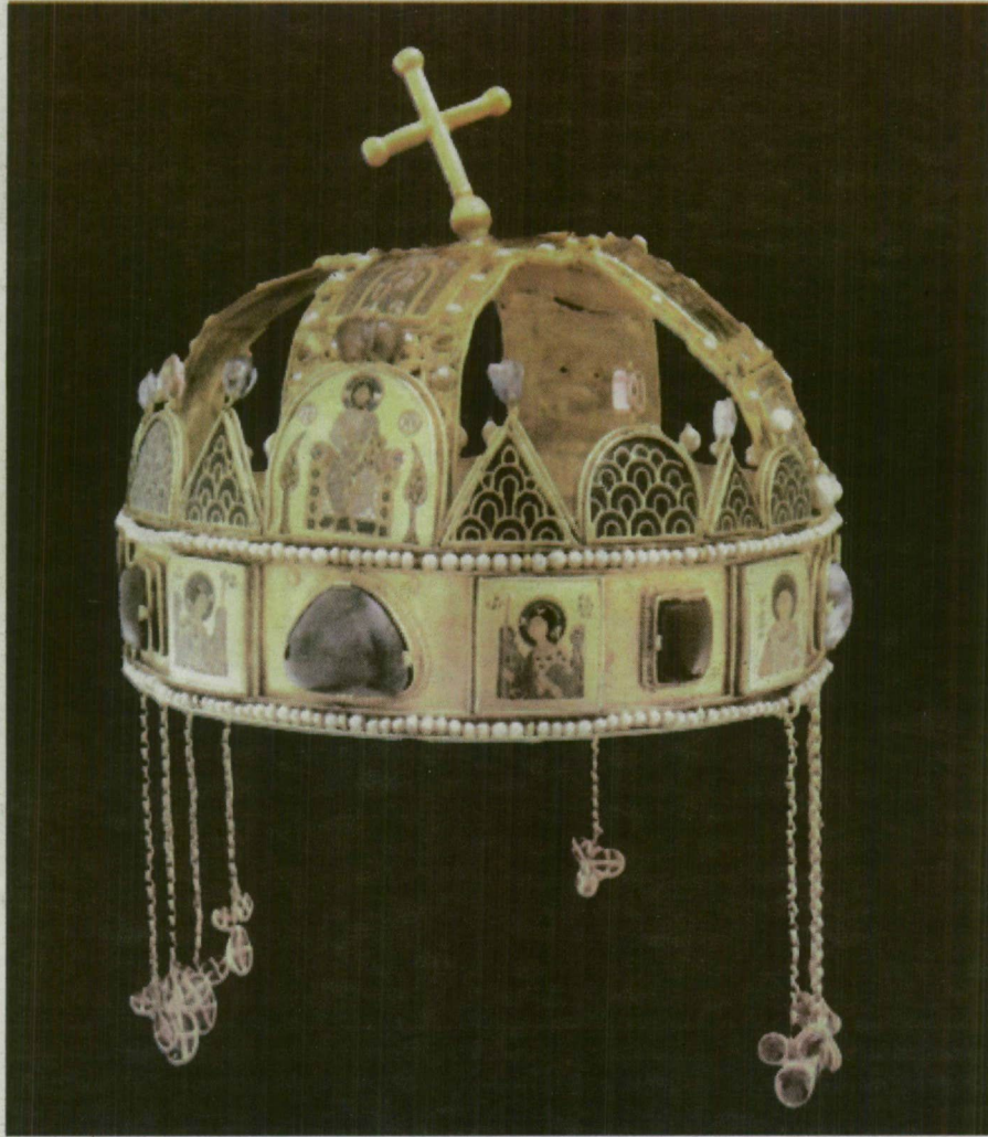
A magyar Szent Korona egy bizánci eredetű alsó és egy latin felső részből áll.

– Az átadást nagy valószínűséggel kemény diplomáciai tárgyalások előzhették meg. A Hartvik-legendák inkább azt jelzi, hogy a középkorban az utódok képzelete hajlamos volt képiesen megőrizni a fontos eseményeket. Gondoljunk arra, amikor az 1059-es várkonyi jelenetben Bélának választania kellett a korona és a kard között. A népi képzelet ezt úgy adta elő, hogy I. András egy vörös posztón jellemezte a királyságot jelképező koronát és a hercegséget szimbolizáló kardot, s ha Béla a koronát választotta volna,