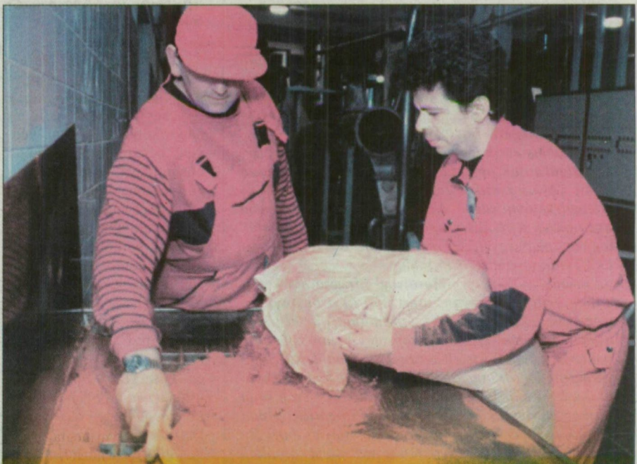
Röszkei zsákolók. A helyi paprikamalomból évente több száz tonna örölt fűszerpaprikát szállítanak külföldre.

K. L., gépkocsivezető, jelenleg munkanélküli: – Egy évem van hátra a nyugdíjig. Az elmúlt időszak minden szempontból csak bizonytalanságot hozott számomra. Nemrég volt egy nagyon csúnya balesetem, ami után elvesztettem az állásomat. Így félek minden betegségtől, nehogy az agyhártyagyulladás-tól. Rendszeresen hallgatom a tudósításokat és szorongással töltenek el a hírek. Ilyen esetben szerintem a legfontosabb a megelőzés és a higiénia. Persze ezt nem könnyű megvalósítani a zárt közösségekben, mint például a katonai laktanyákban.