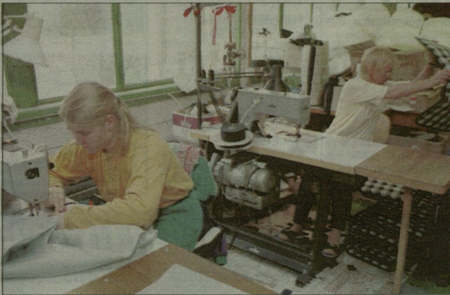
Harmincötven tizenöt ezer gyermekocsit gyártanak az idén Algyón.