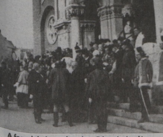
A fogadalmi templom és a Dóm tér átadása 1930. október 25-én, Horthy Miklós kormányzó jelenlétében.