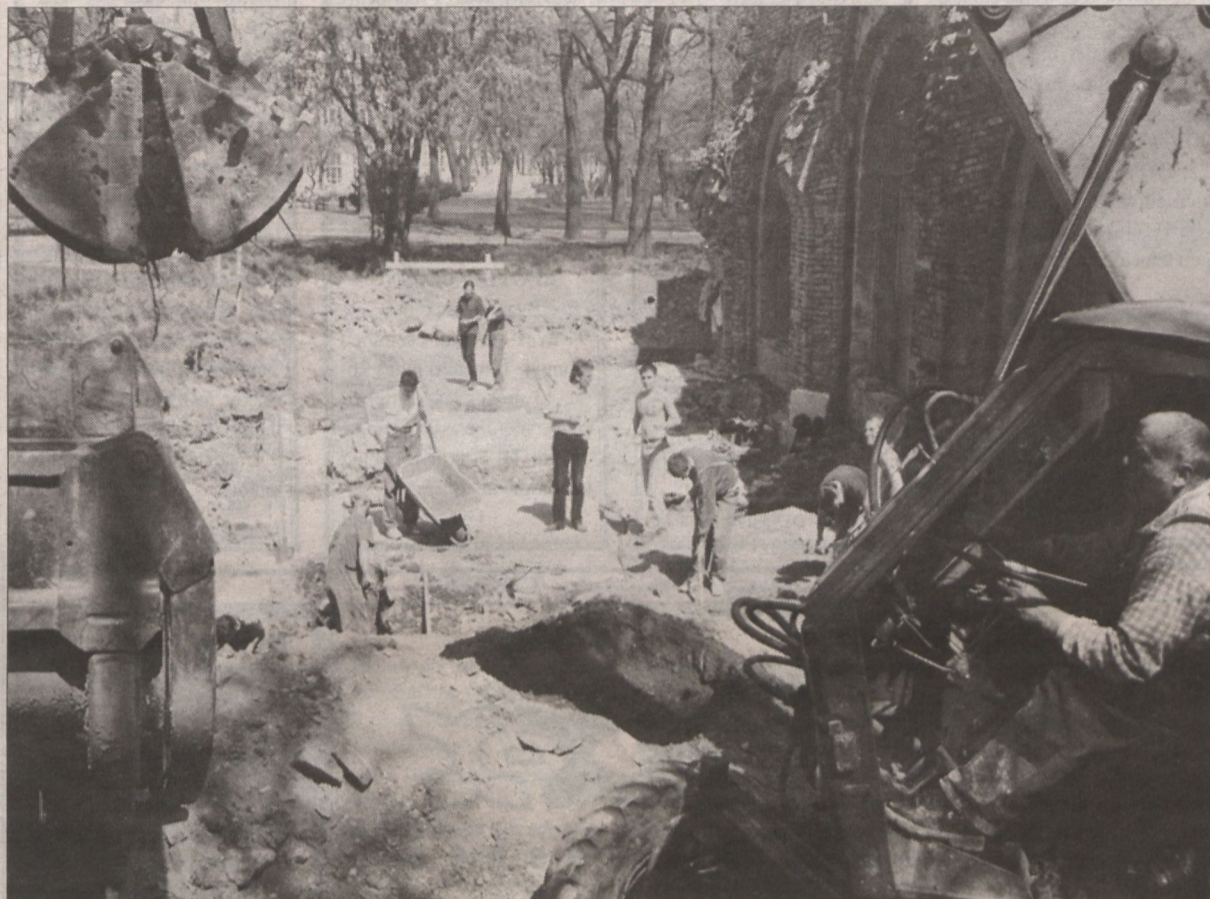
A vár középkori templomának maradványai tavasszal kerültek elő.

A szegedi vár maradványa nemcsak azért érdemel figyelmet, mert a város egyik turistalátványosságává válhat belőle (és a középkori templom romjaiból) a várkerítési munkálatok következtében. A vár a történelem folyamán többször volt jelentős események színhelye.