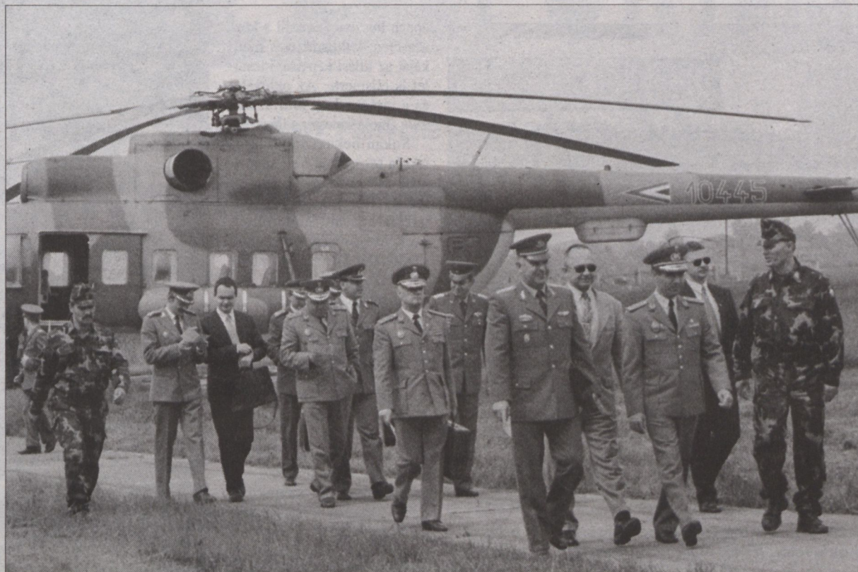
Szombaton délelőtt a magas rangú román-magyar katonai delegáció helikopterrel érkezett meg Vásárhelyre.