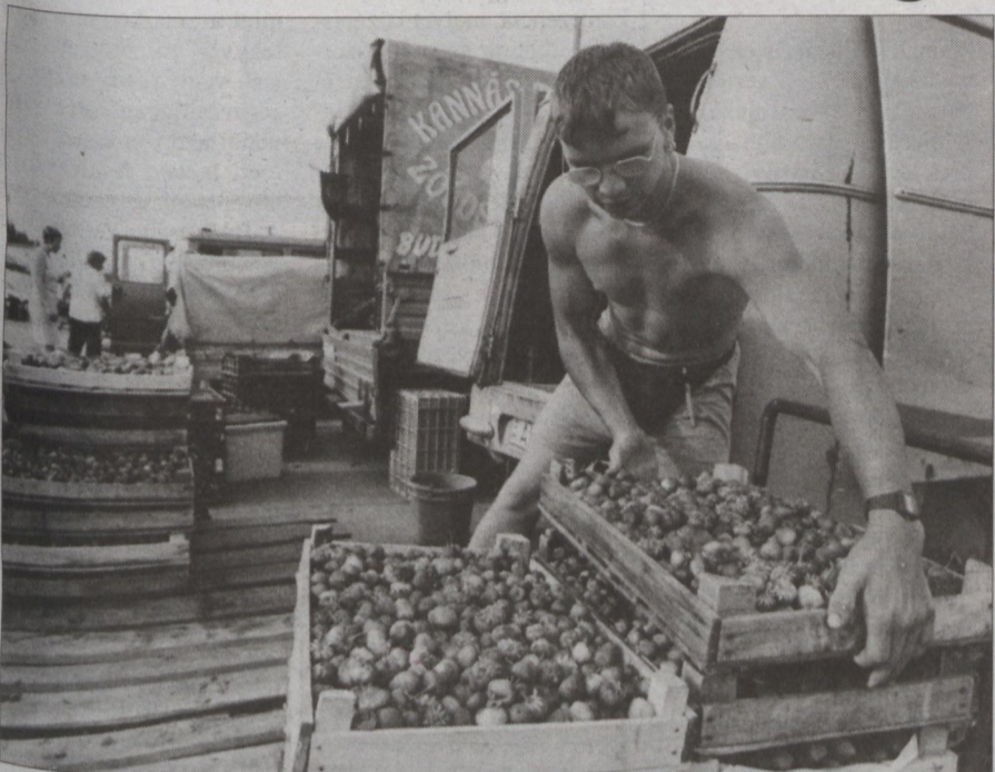
Mezőgazdasági terület: az agrárium csak 11 százalékkal járul hozzá a GDP-hez.

Természetes érdeklődés él az emberekben, hogy a térség, amelyben élnek milyen gazdag, mennyire fejlett és más térségekhez mérten milyen megélhetést, milyen életkörülményeket tud nyújtani lakosainak. A statisztika sokáig csak a különféle termelési, forgalmi, kereseti, ellátottsági mutatószámok sorával tudott közelítő választ adni erre a kérdésre. A nemzetgazdaságban megfigyelt aktivitás egyik leglátogatóbb és legbeszédesebb jellemzőjét, a GDP-t, vagyis a bruttó hazai terméket a Központi Statisztikai Hivatal csak néhány éve képes megadni szinten is meghatározni. A legfrissebb – 1997. évre vonatkozó – megyei szintű adatokat a napokban tette közzé a KSH.